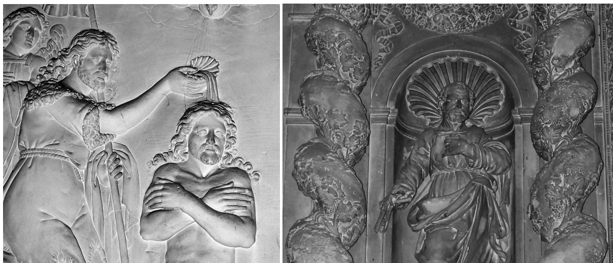
Op het hoofdaltaar van de Saint-Pierre kerk in Saint-Paul-de-Fenouillet is goed te zien hoe belangrijk de Sint-Jacobsschelp was voor onder andere de Heilige Petrus. Bij het doopfont is ook een stucwerkscène te zien van Johannes de Doper die Jezus doopt met een Sint-Jacobsschelp.

geribbelde bovenschalen en een aardse andere, platte helft. Dit zegt veel over de achtergrond van Nehalennia, want dat soort verbeeldingen van hemel en aarde zijn ook terug te zien binnen andere oude religies en dan soms ook uitgewerkt met vrucht- of eierschalen. Goden die met deze symbolieken zijn afgebeeld, kunnen beschouwd worden als scheppers. Brahma, de god die volgens de hindoes het materiële universum heeft gecreëerd, is daar een voorbeeld van. Hij bracht een jaar in een ei door en maakte daarna van de twee stukken schaal de hemel en aarde. 74 De schelp van Nehalennia verduidelijkt dan ook dat ze heerschappij had over zowel de lucht als het land en dat sluit aan bij veronderstellingen waarin ze niet alleen gezien is als een watergodin, maar ook beschouwd werd als een vertolkster van de maan.