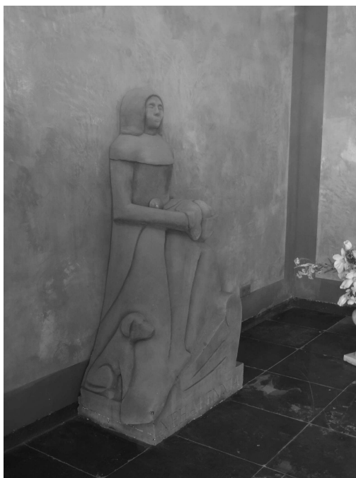
Het beeld van Nehalennia dat te zien is in de tempelreplica langs het haventje van Colijnsplaat.

De tweede kapel zou ergens in de buurt van Domburg hebben gestaan. Men veronderstelde dat het duingebied van Domburg in die tijd veel verder reikte dan tegenwoordig het geval is en dat de resten van deze tweede tempel zo'n 200 a 300 meter verwijderd van de kust in de zee zouden liggen. Een visser uit Veere vond tijdens de Tweede Wereldoorlog bij de zogeheten Put van Domburg , op een diepte van 24 meter een votiefsteen die aan Nehalennia gewijd was en men achtte het aannemelijk dat die vondst de hypothese over de tweede tempellocatie bevestigde. 83