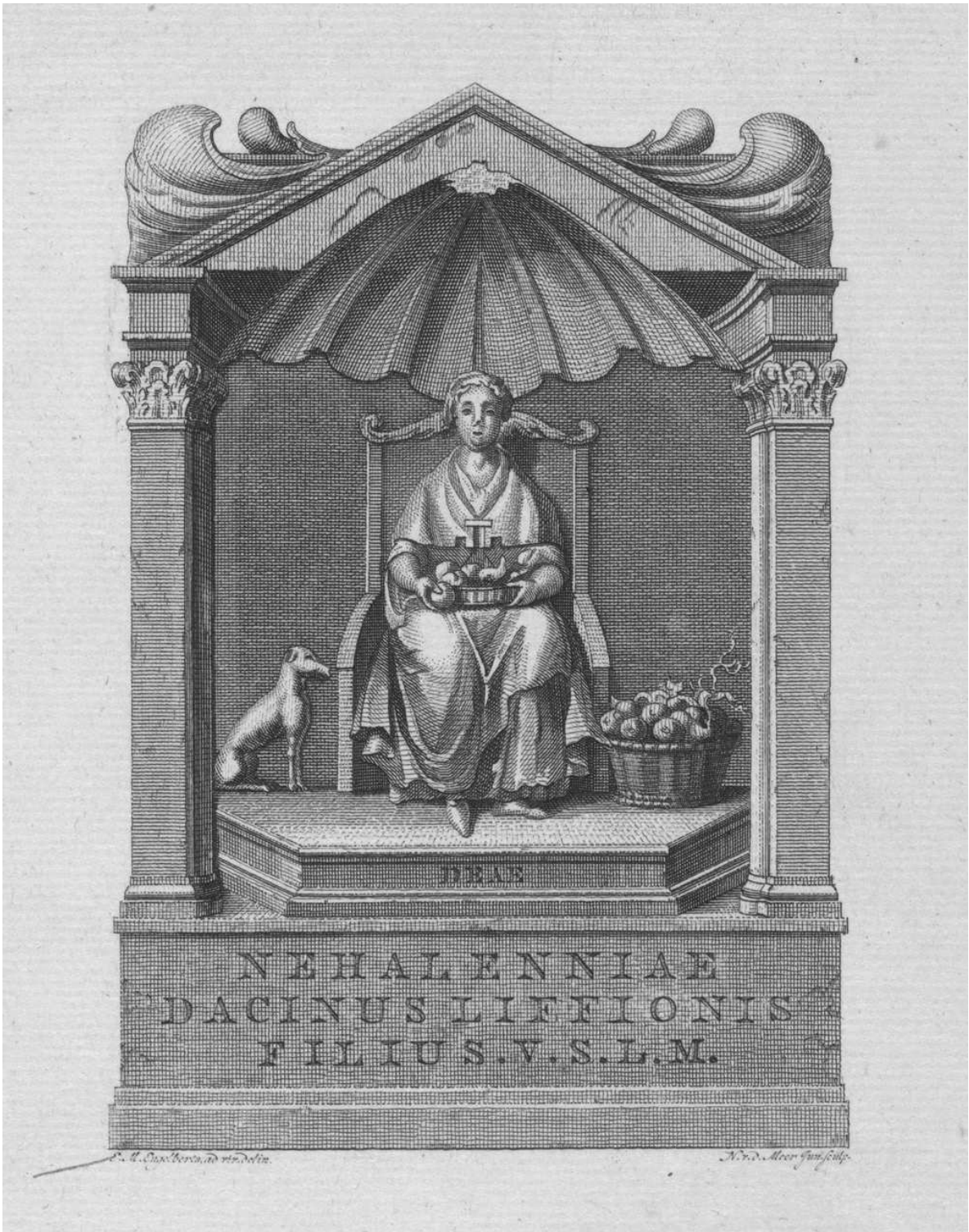
Altaar voor Nehalennia. 2