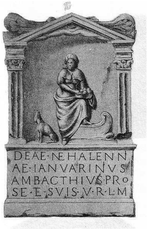
Links zie je het glas-in-loodraam in de kerk van Bugarach. De kerk is centraal gelegen in de schaduw van de Pic de Bugarach, een grote berg. Rechts een afbeelding waarop Nehalennia staat afgebeeld met een négo . Deze votiefsteen is in Domburg gevonden. 86