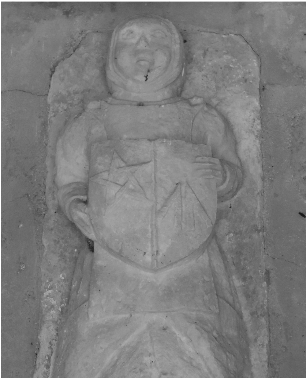
Vermoedelijk een weergave van Nehalennia bij de Notre-Dame-de-Laval in Caudiès-de-Fenouillèdes.

haar benaming Liesse wel eens aan de orde waren gekomen, was ik extra alert op symbolieken die verwijzingen naar deze godin konden zijn. Nehalennia heeft ongetwijfeld bij de Tempeliers een rol gespeeld binnen hun religieuze beleving en tijdens filosofische beschouwingen. Het is een aspect dat nog vaker in dit boek aan de orde zal komen.