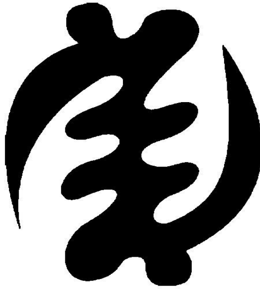
Gye Nyame (God)