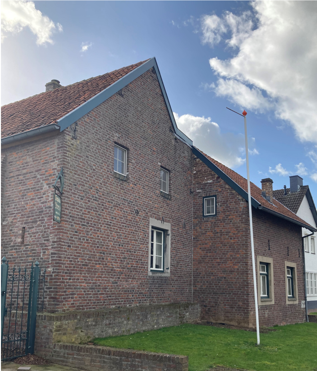
Woonhuis van Reinoud Jessen, Everstraat 4.

Vroeger lag ten westen van Geleen en Sittard het Graetbos. Nadat dit was vergaan sprak men van Graetheide. Het Graetbos werd in 1250 als Graite , in 1271 als Grate en 1272 als Graden aangeduid. Een 14 e eeuwse document spreekt over de rechten en plichten van het bos als 'Het Bescheyt van den Graet'. Afgeleid van het