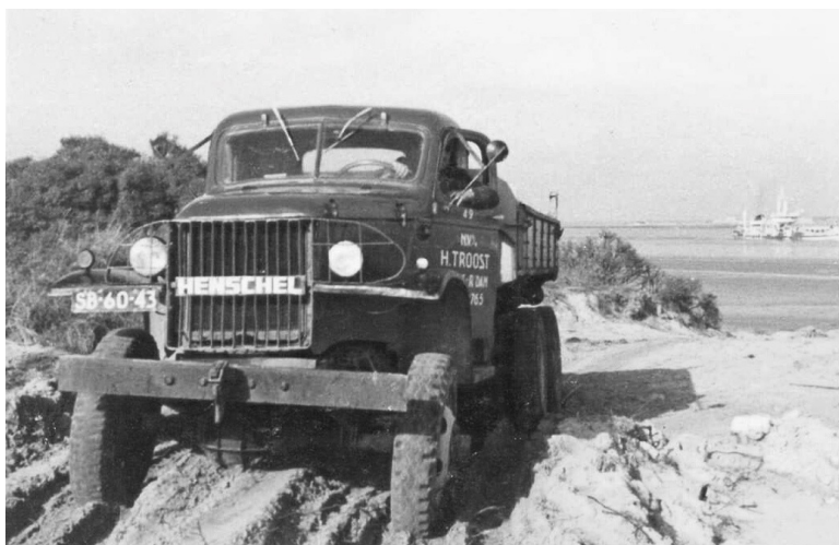
*Een GMC CCKW van de firma Troost uit Pernis aan 't werk.

Dergelijke aanvoer van gegevens en foto's zorgt er mede voor dat je als auteur weer wat extra motivatie krijgt om in de weer te blijven met het schrijven van historische boeken. Een recent voorbeeld is dat ik in april van dit jaar (2021) via reacties op facebook te horen kreeg dat ondermeer de aannemers Mourik (Groot Ammers) en Troost (Pernis-Rotterdam) in onze regio mee hebben gewerkt (met hun GMC CCKW kippers) om na de Watersnoodramp van 1953 dijken te dichtten. En later ook nog betrokken waren bij de dijkversterkingen in de Hoeksche Waard en trouwens het hele Rijnmondgebied. Logisch natuurlijk, als je er goed over nadenkt, want zeker in 1953 hadden veel aannemers, die bezig waren met grondverzet vaak nog maar een beperkt aantal trucks. En dus moesten vrijwel alle bedrijven met vrachtwagens en zeker met kippers aan de slag. Alleen massale inzet van materieel kon ervoor zorgen dat de dijken zo snel als mogelijk was weer werden gedicht.