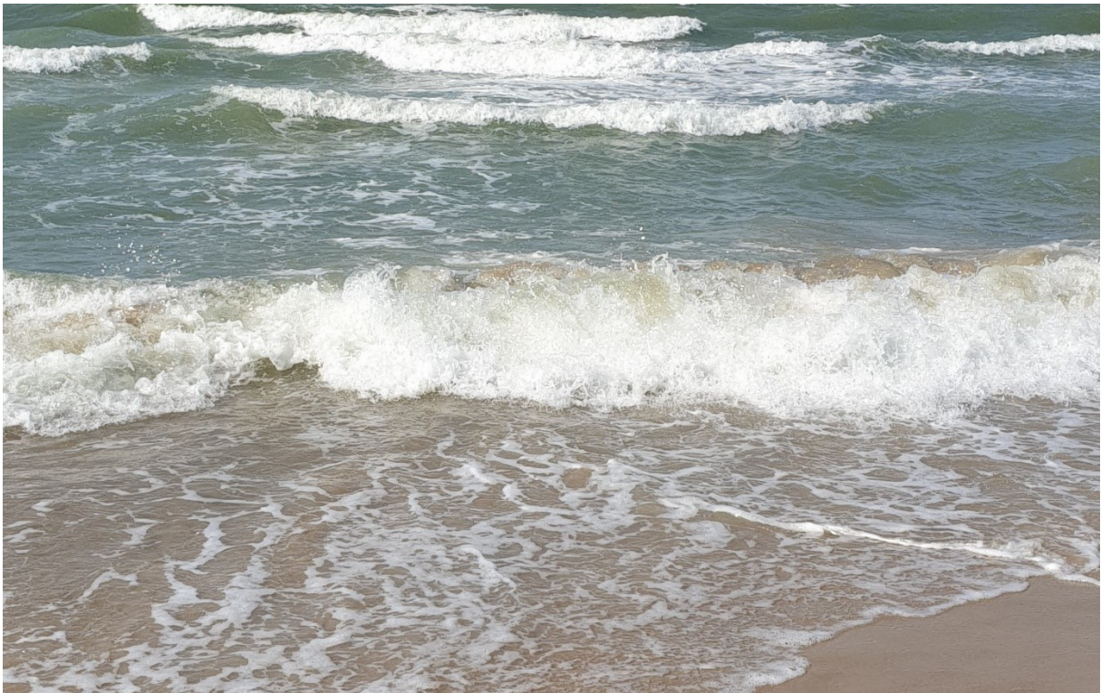
Oostkapelle, Zeeland (2021)