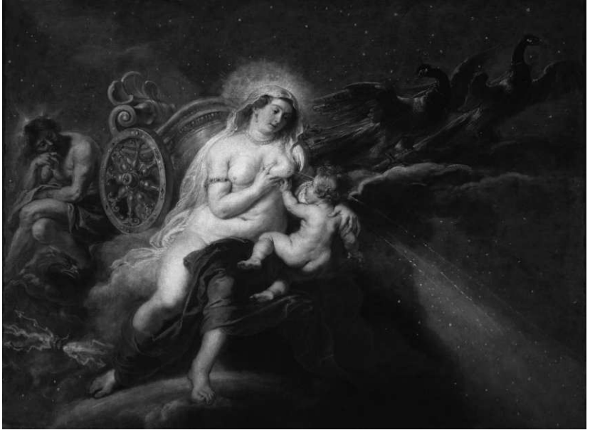
Rubens - Via Lactae 1636

Er is ook een mogelijkheid dat met de Bifrost-brug uit de Edda niet altijd de regenboog, maar ook een aantal malen de Melkweg wordt bedoeld. Ten laatste wordt de Melkweg ook wel de 'Helweg' genoemd. (8)