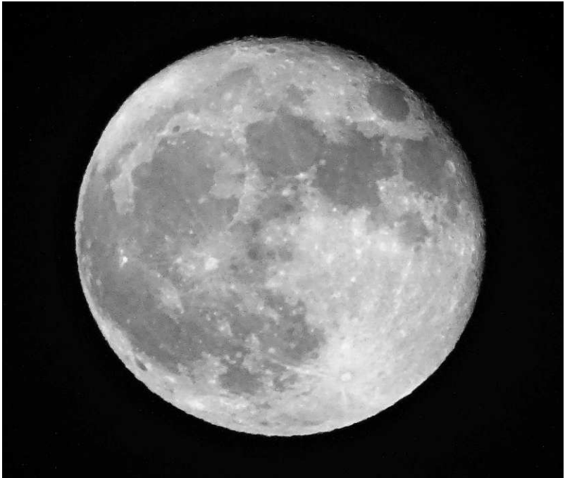
Rechtsboven kan je – met wat verbeelding - de haas zien die over de maan springt.

hemelgodin Nut werd dat verhinderd door de oppergod Atoem. Thoth had medelijden en verzoon een list om hen toch geboren te laten worden. Hij speelde een soort van schaak met de maangod Khonsu en won van hem 1/72e deel van zijn licht. Mogelijk liet Thoth dit gewonnen licht door zijn boodschapper de haas halen. De vlekken van de maan werden – ook toen al - gezien als een haas, die bezig is om over de maan te springen. Dit deed hij dan in opdracht van Thoth om het licht van de maan mee te nemen. De haas wordt ook wel afgebeeld als slachter van de maan-slang, wat de connectie van de haas met de maan versterkt. Met het licht van de maan kon Thoth vijf dagen creëren waarin Nut haar kinderen (Isis, Osiris, Nephtys, Set en Horus) kon baren. Sindsdien kon de maan niet meer volop schijnen en ontstond de maancyclus waarin zij afneemt van een volle maan tot slechts een sikkel.