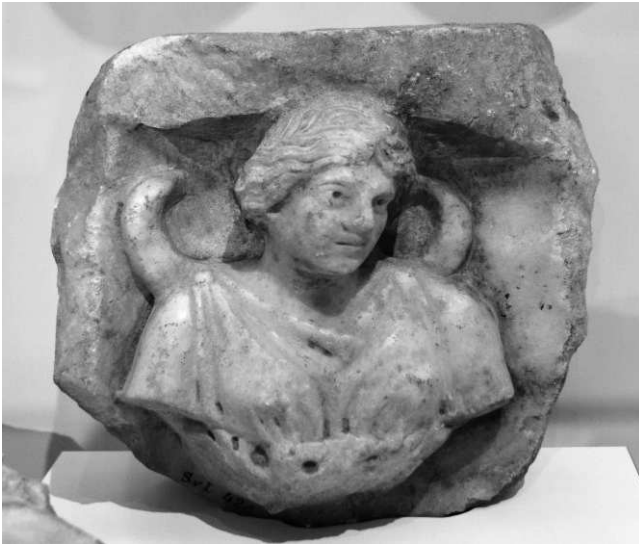
De maangodin Luna (Smyrna 2 e eeuw n.o.j.)

In dit hoofdstuk geef ik voorbeelden van het geloof dat de maan een grote invloed op de mens heeft. Zij werd gezien als Godin, als plaats van 'mana' - oftewel energie - en als plaats van de 'manes', de zielen. (1)