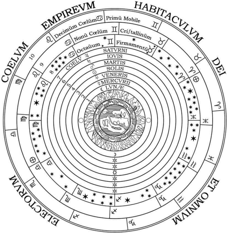
Een schema van het Ptolemaeïsche wereldbeeld van Peter Apian in 'Cosmographia' (1539)

compleet verlaten. Zij is aan de andere kant van de sterren terecht gekomen, of wellicht beter gezegd: zij is samengevallen met haar ster.