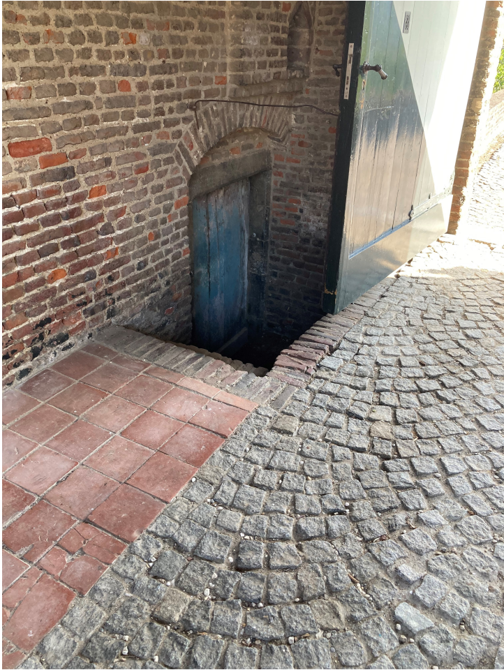
Toegang tot de burchtkerkers.