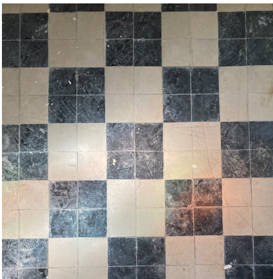
Vloer van de kapel.