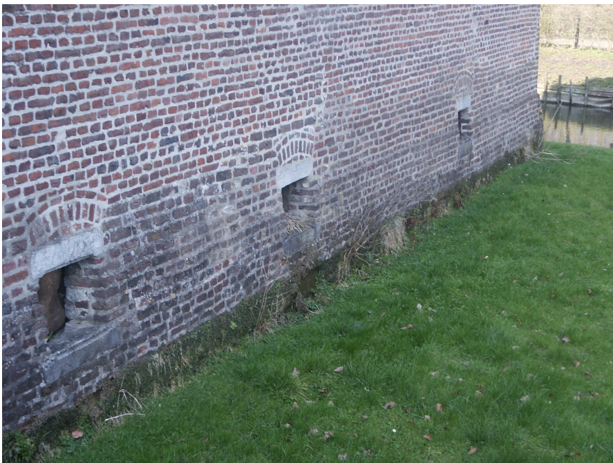
Burchtkerker van Terborgh.

'Kasteel Terborgh was tevens schepenbank en gevangenis, in roerige tijden. Rond de 18 e eeuw werd in de gevangenis van de burchthoeve leden van de zogenaamde 'bokkenrijders' ingesloten. De burchtkerker van de bokkenrijders zijn nog steeds te zien door het, inmiddels geblokkeerde, trapje rechts naar beneden te nemen als men door de poort gaat.'