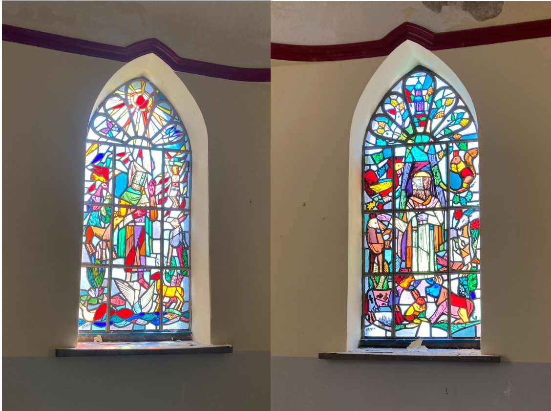
Binnenkant van de kapel.

inrichting van de kapel is tegenwoordig niets meer overgebleven, behalve de twee gebrandschilderde ramen en de vloer':