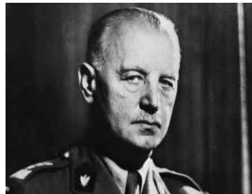
Generaal Wadyslaw Sikorski 1881-1943