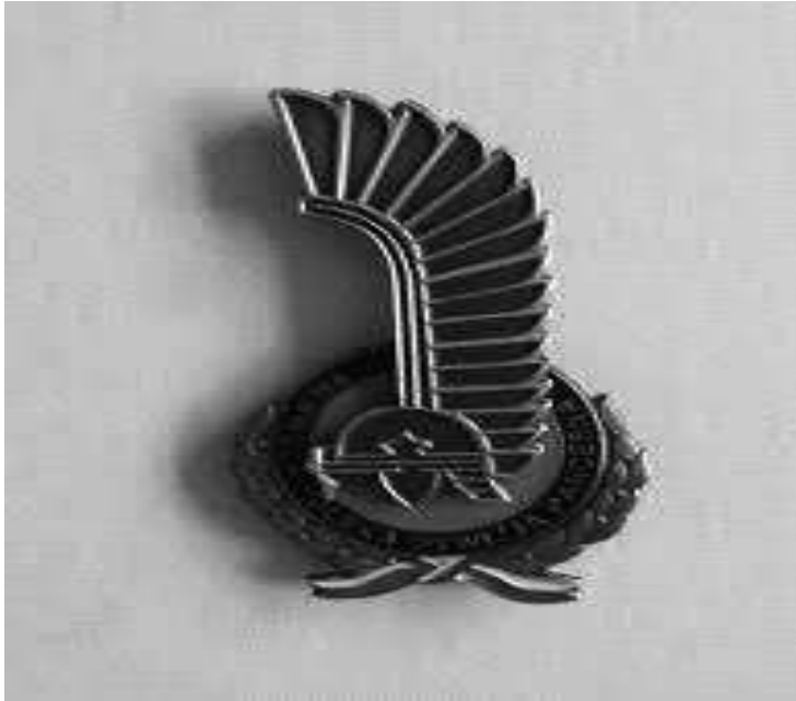
Insigne van de 1 e Poolse Pantserdivisie