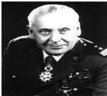
Generaal Stanislaw Maczek