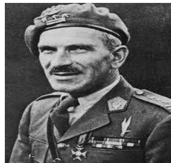
Generaal Stanislaw SosaBowski