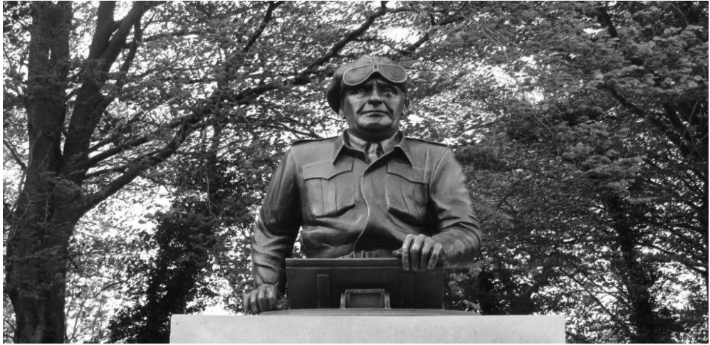
Generaal Stanislaw Maczek. Generaal 1 o Poolse Pantserdivisie