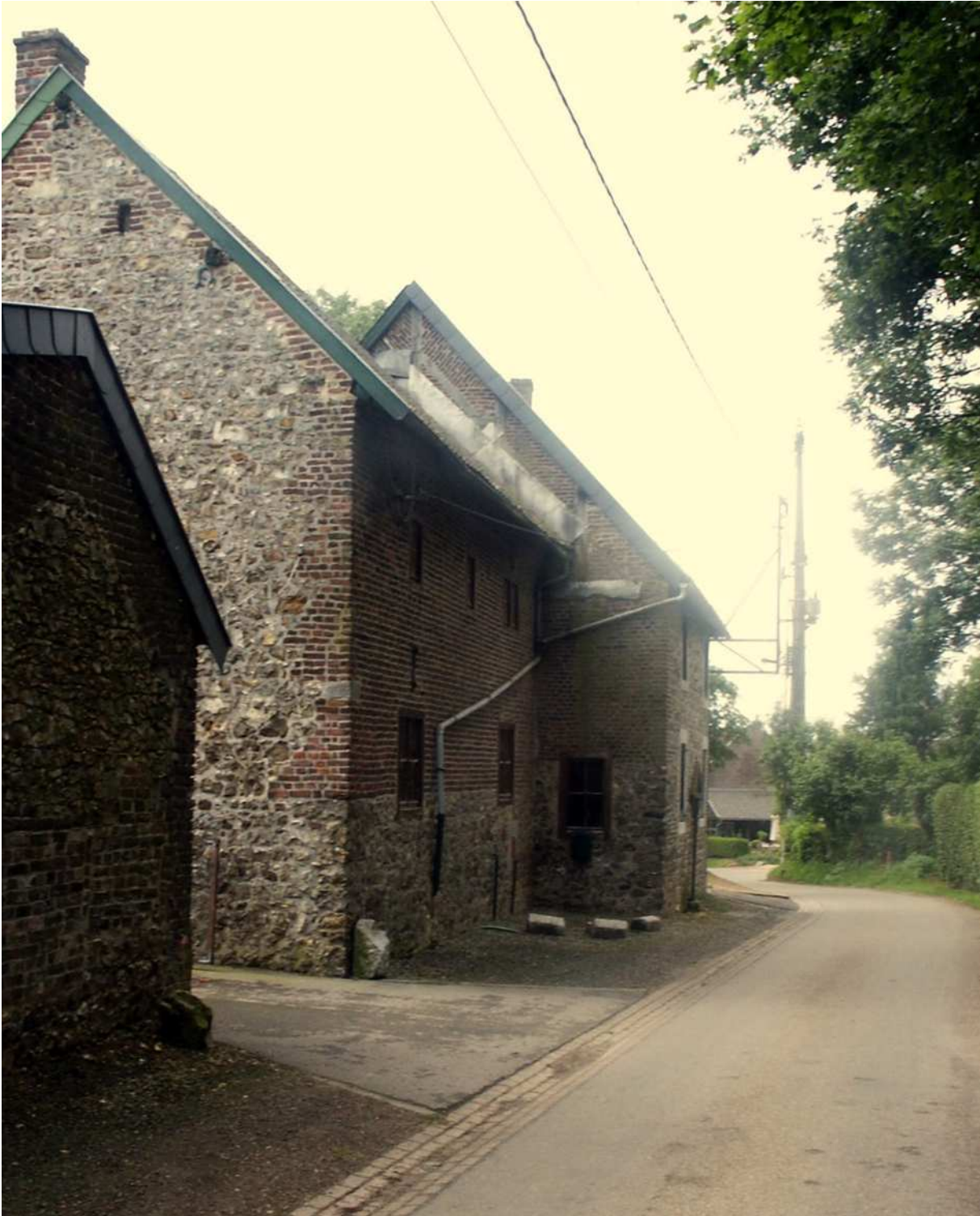
Sfeerimpressie Ulvend. Een eerste kennismaking.