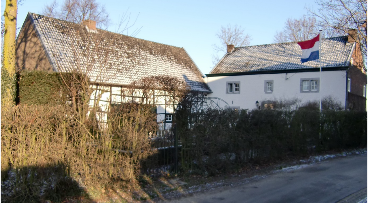
Woning van Amber in de winter met de Nederlandse driekleur.

De verbindingsweg tussen Ulvend en de Plank de Plankerweg werd genoemd.