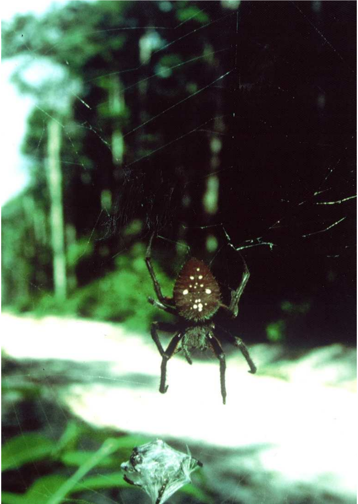
De wachter van de witzandweg.