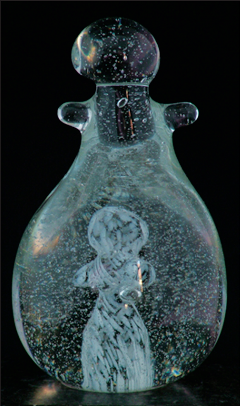
NIEUW LEVEN vrijgevormd warm glas / H 12 cm