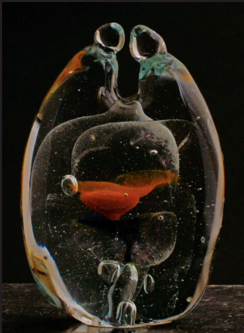
GOEDENDAG - NAMASTE / vrijgevoemd warm glas / H 14 cm