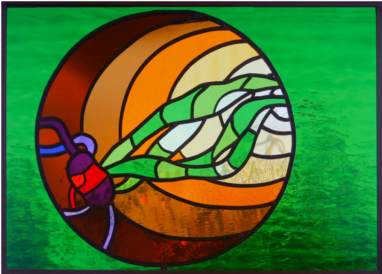
Het resultaat in glas-in-lood.

De cardioloog zei: "wanneer is het gebeurd, afgelopen vrijdag, nou dan is het er al drie dagen geleden. Ik ben benieuwd of ik er nog wel door kan komen ". Dat was geen geruststellende opmerking. Als het hem niet zou lukken, wat dan? Dan zou ik alsnog geopereerd moeten worden.