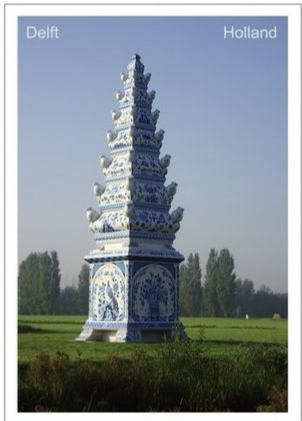
De kaarten van de Markt en de tulpenvaas die op de vorige pagina werden beschreven.