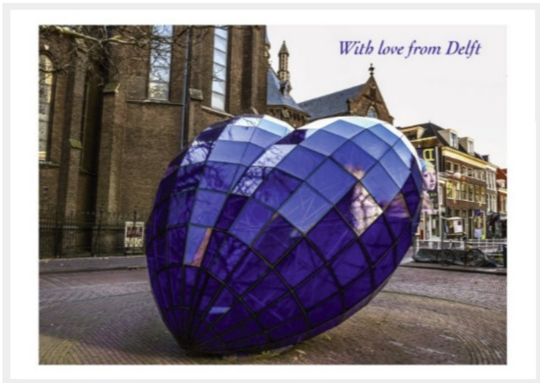
Het Blauwe Hart waarachter het meisje met de parel steeds om het hoekje kijkt