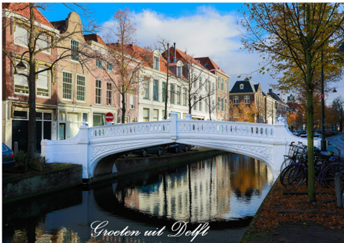
Het begon met deze kaart van fotograaf Marlon Otten