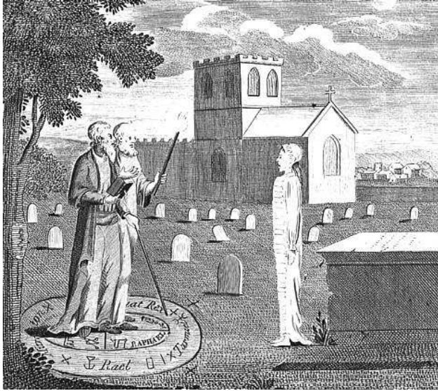
Grabado de John Dee y Edward Kelly evocando "en el acto de evocar el espíritu de una mujer fallecida", Astrología de Ebenezer Sably, Londres, 1806.

En el siglo XIX, Eliphas Levi, un mago y autor, también usó un ritual nigromántico para evocar el espíritu de Apolonio de Tyana. Levi escribió en su libro, "Los Misterios de la Magia" (también conocido como Las Historias de la Magia):