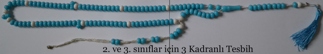
2. ve 3. sınıflar için 3 Kadranlı Tesbih