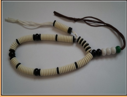
Rasidi Tarikat Rondelle Tesbih Modelleri