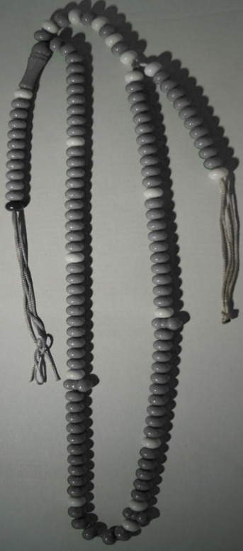
Baş ağaçlı Raşit Tunca 2019