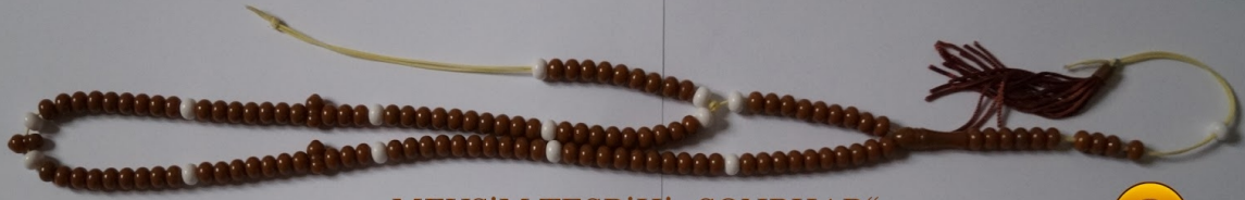
MEVSiM TESBiHi „SONBHAR“