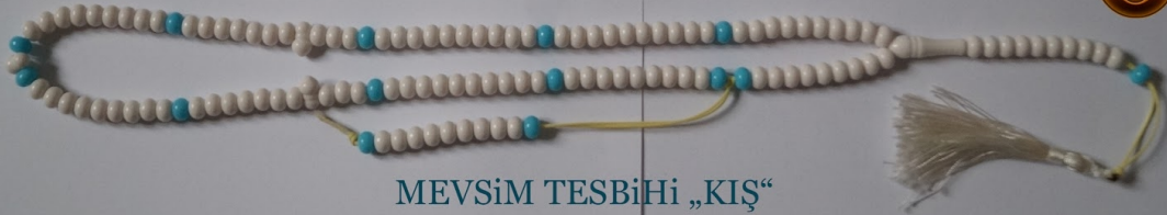
MEVSiM TESBiHi „KİŞ“