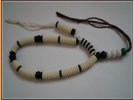
Raşidi Tarikatı Rondelle Tesbih Modelleri