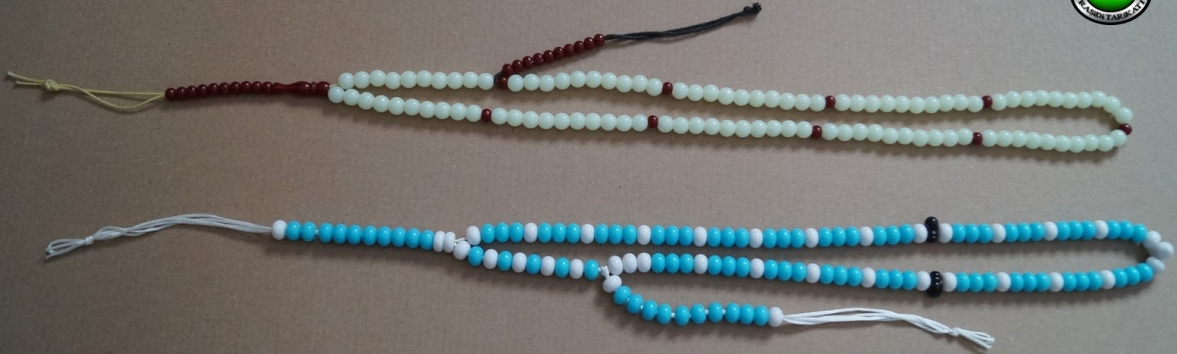
4 Kadranlı Turkuaz 1. ,2. , 3. Sınıfların Tesbihi 3 lü Dizilim