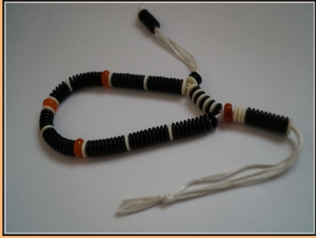
Rasidi Tarikat Rondelle Tesbih Modelleri