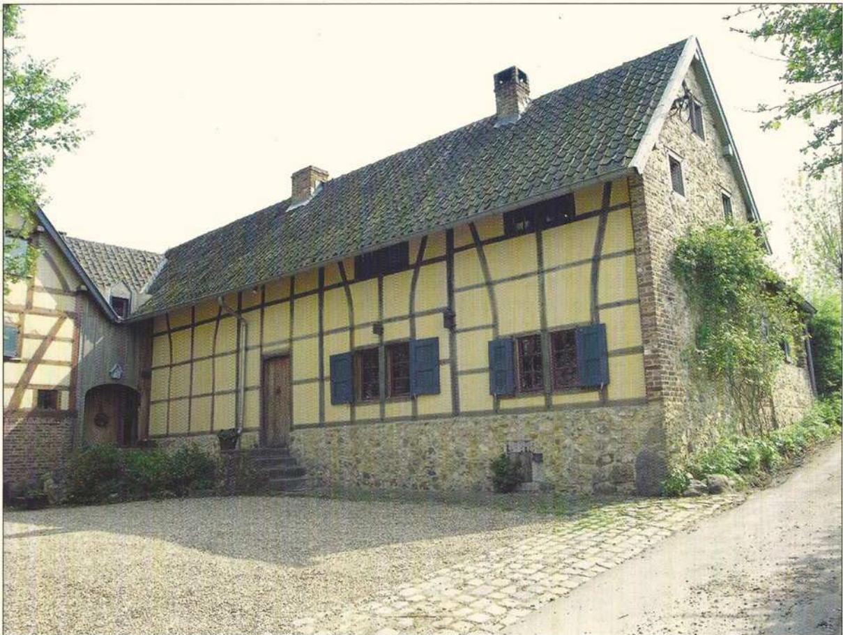
Voorkant huis Anthea.

Gaan we met jouw auto of de mijne?, vroeg Reinoud. De mijne, antwoordde Maureen. Ze reden Moelingen binnen en van daaruit naar 's-Gravenvoeren. Het dorp met de honderd bruggetjes. We moeten verder door, riep Reinoud. Naar Sint-Martensvoeren. Maureen stuurde de auto naar Sint-Martensvoeren, één van de drie Voerens. De derde was Sint-Pietersvoeren. Hier naar echts, zei Reinoud dan komen we er vanzelf. Na enig zoeken vonden ze het woonhuis van Anthea.