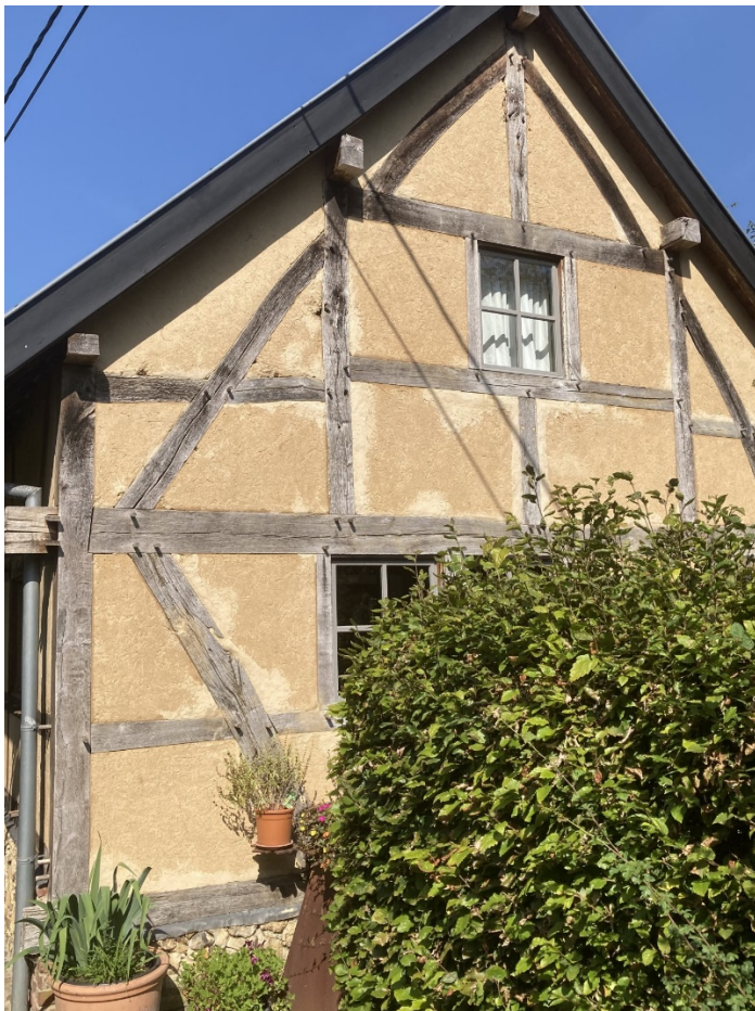
Vakwerk in Veurs.

Morgen hebben we allebei vrijaf en kunnen we Anthea bezoeken. We worden verwacht. Reinoud nam nog een kaart erbij en zocht naar het plaatsje Veurs.