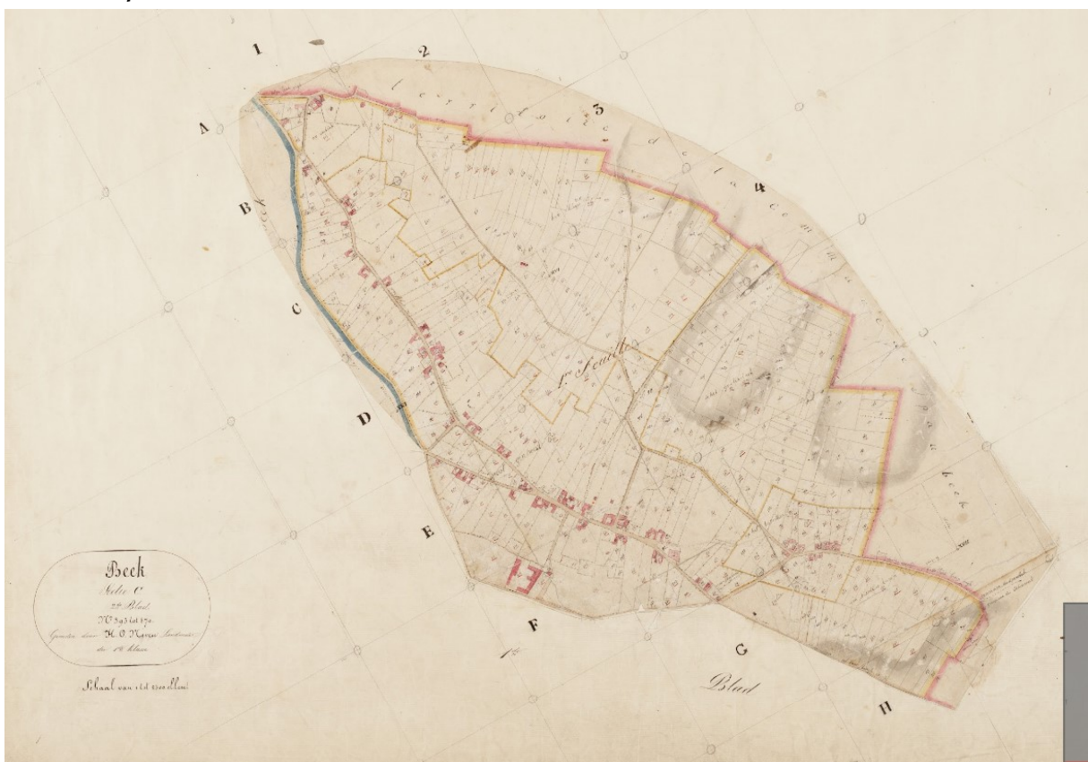
Minuutplan Beek (Groot-Genhout).