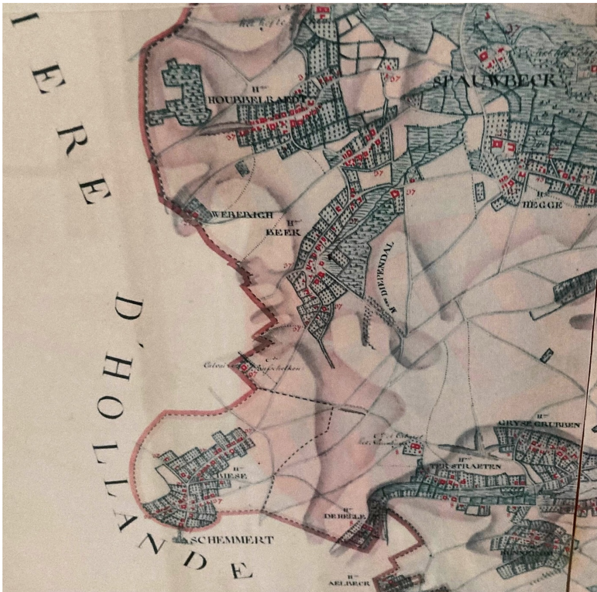
Spaubeek op de Ferrariskaart (1771-1778), de oudste gedeeltelijk gedetailleerde kaart van Limburg.

Zijn de voorvoegsels van het toponiem gemakkelijk te traceren, veel moeilijker is dat voor wat betreft oorsprong, afkomst en betekenis van de 'unieke kernbenaming'.