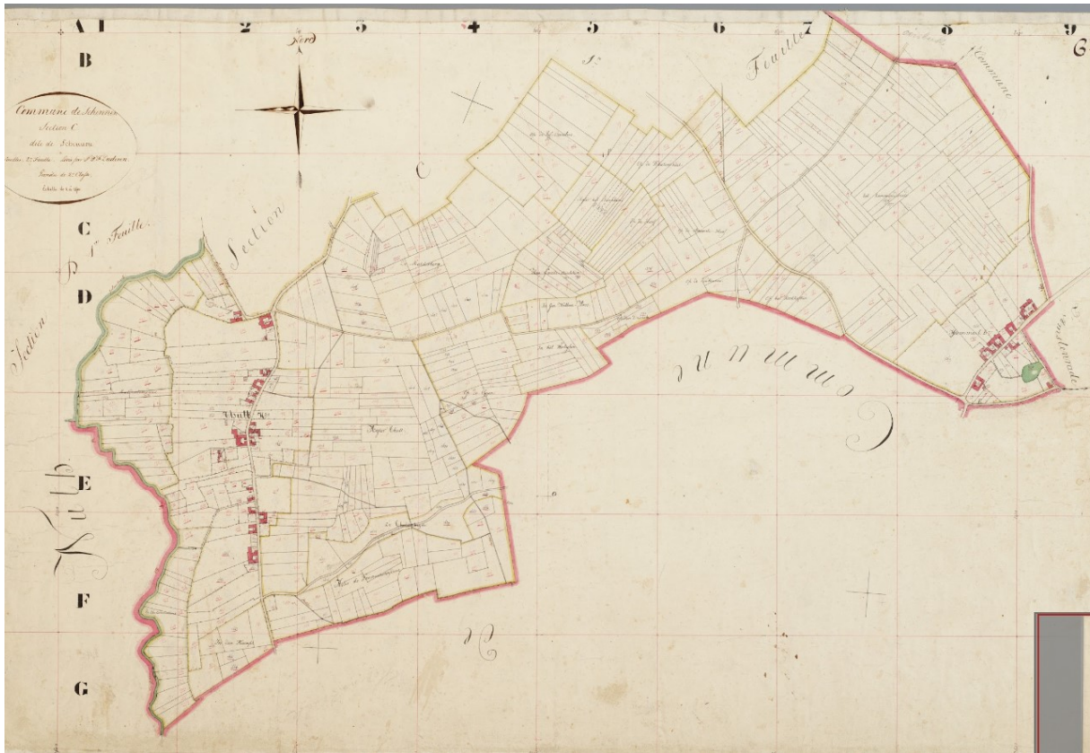
Minuutplan Schinnen (Thull).