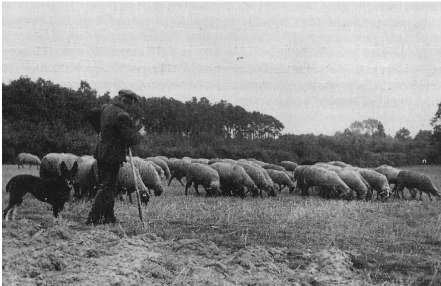
Laatste schapendrift op de Graetheide.