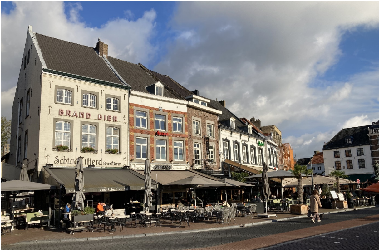
Panorama van de Markt.

Her en der waren met Portland cement gestucte raamomlijstingen te zien van 19e eeuwse panden, zoals restaurant 'De Buren', eetcafé 'Den Gulden Haen' en restaurant 'Luna', het favoriete restaurant van de vrijmetselaars.