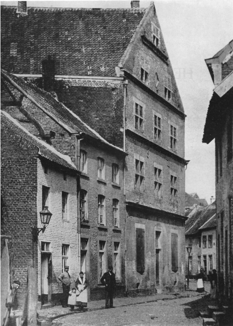
Kritzraedthuis voor de restauratie.

In het huis namen in 1636 de jezuieten hun intrek, onder leiding van Jacob Kritzraedt van Gangelt die kort na 1649 als eerste de geschiedenis van deze regio heeft geschreven. Naar hem is dit huis genoemd, dat in 1677 de grote stadsbrand doorstond.