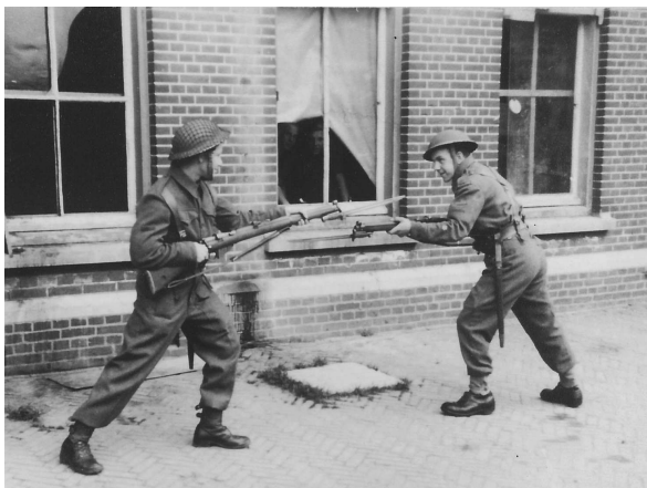
Figuur 4 2e Regiment Pioniers, bajonet vechten. 1944-1945.

Soldaten: jarenlang waren ze een vertrouwd gezicht in onze omgeving. Je kwam ze overal tegen. Je zag ze op straat als ze aan het lessen waren. In de natuurgebieden rondom de stad, zoals de Grootte Heide en de Crayelheide, tijdens één van de vele oefeningen die daar gehouden werden. En ook in de avonden, wanneer ze verlof hadden, liep je ze tegen het lijf in één van de vele uitgaansgelegenheden in het centrum van Blerick of Venlo. De soldaten lagen op de kazerne in de bedding van de Maas tegenover de stad Venlo, een terrein dat zowel door Venlonaren als Blericknaren geclaimd wordt als het hunne.