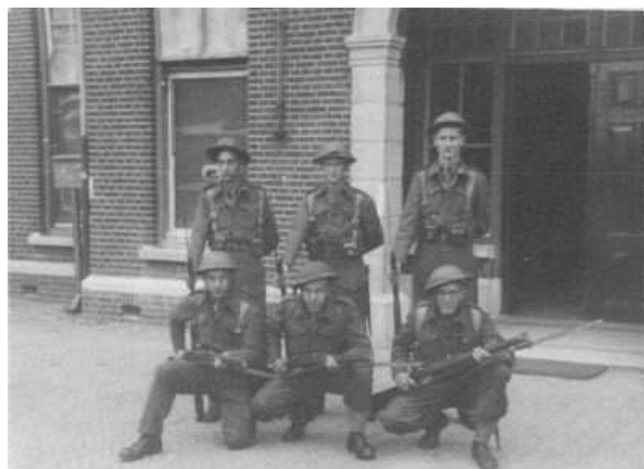
Figuur 5 2e Regiment Pioniers 1945. Voor het wachtgebouw.

De kazerne is gebouwd in 1913 en heeft nog