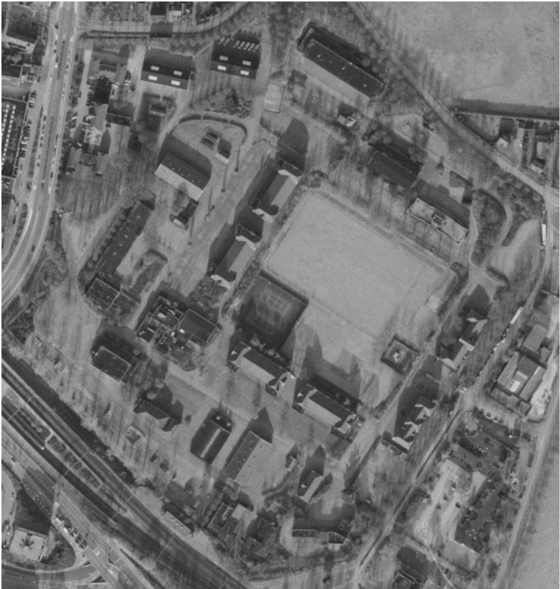
Figuur 7 Luchtfoto kazerne.