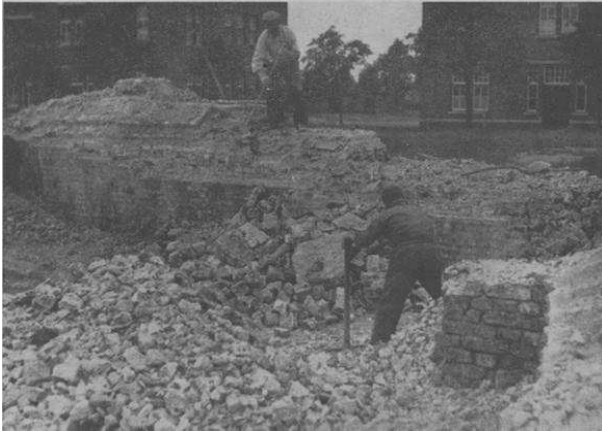
Figuur 7 Sloop van de overgebleven fort delen

Het kazerneterrein is een plek met een grote militaire geschiedenis. Hieronder in het kort de geschiedenis die van invloed was op de bouw van de kazerne.