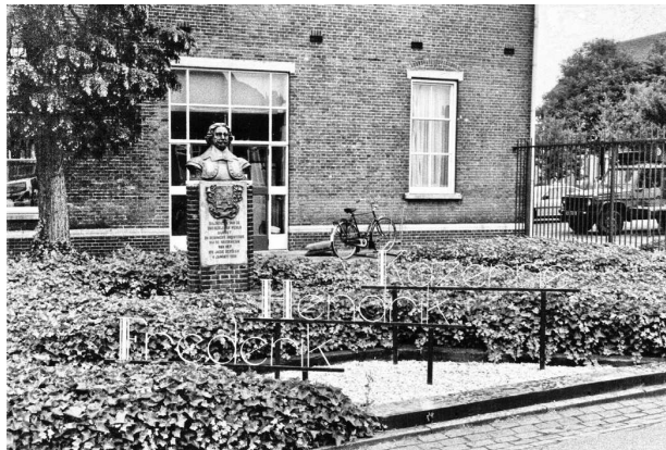
Figuur 22 Borstbeeld Frederik Hendrik nabij ingang direct naast het hoofdgebouw van de kazerne.

In dit boek zal met name een situatieschets gegeven worden van zowel de kazerne als ook de verschillende gebouwen en hun functie. Daarnaast zal er langs een tijdlijn een beeld gegeven worden van de komst en ondergang van de kazerne. De bouw van de kazerne, dat in verschillende fases plaats heeft gevonden, zal ook aan bod komen. Er zal kort stilgestaan worden bij het dagelijkse leven van de soldaten. Daarnaast zal er aandacht besteed worden aan de naam van de kazerne, de verschillende regimenten en gebruikers van de kazerne. Er zullen belangrijke gebeurtenissen zoals koninklijk bezoek, natuurrampen en festiviteiten de revue passeren. En als laatste zal het vertrek van de soldaten en het definitief sluiten van de kazerne aan bod komen. Natuurlijk is dit beeld niet compleet, maar slechts een samenvatting van de bedrijvigheid die op deze unieke plek aan de Maas plaatsgevonden heeft. Een plek waar honderden jaren krijgsgeschiedenis samenkomt.