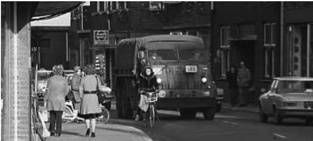
Figuur 8 Lesauto van de Rijkschool Venlo. Soldaten kregen rijlessen in straten van Venlo en Blerick. Deze 3 tonner leswagen rijdt op de Pontanusstraat in Blerick.