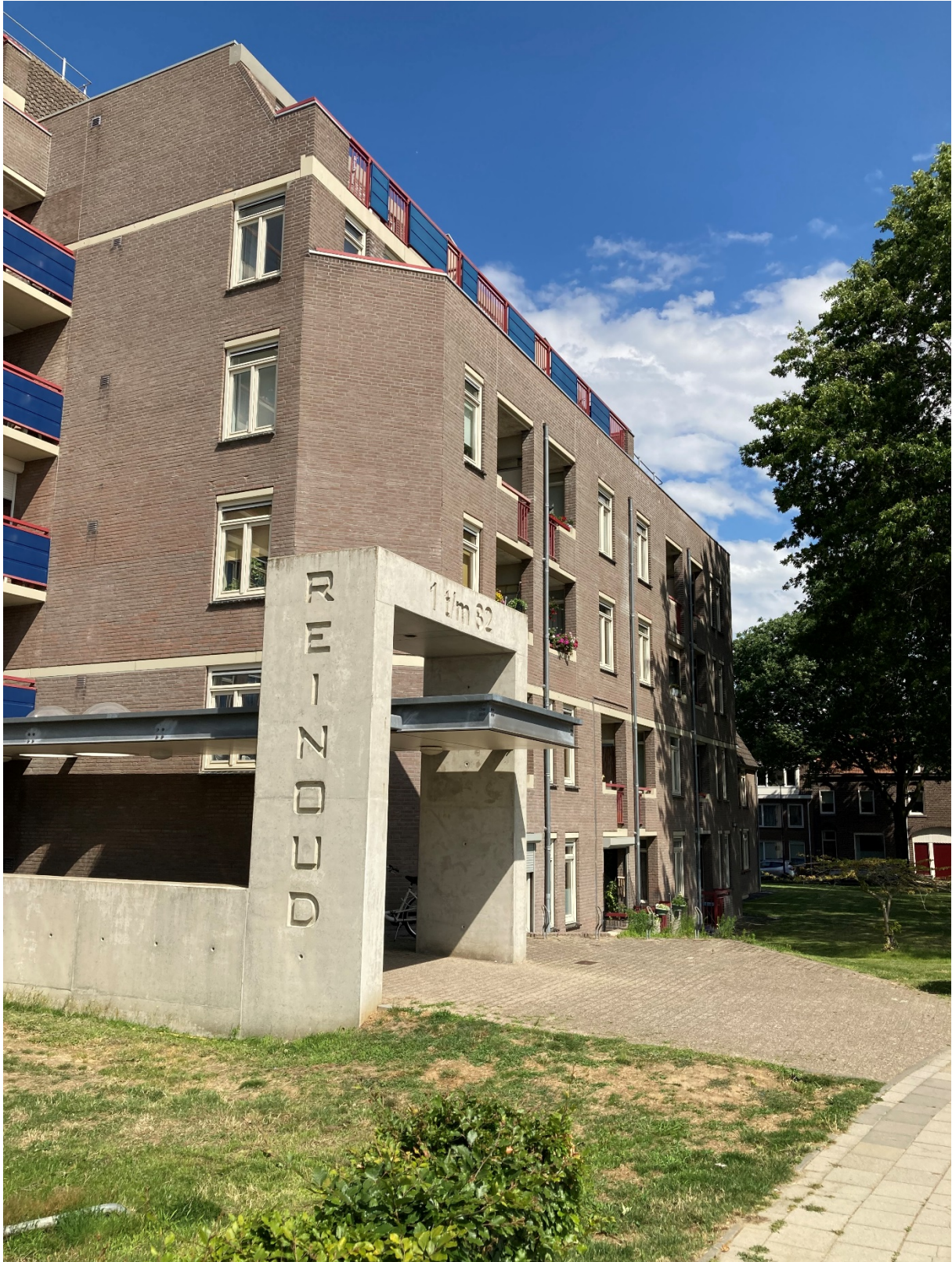
Zijaanzicht ingang Reinoud-flat.