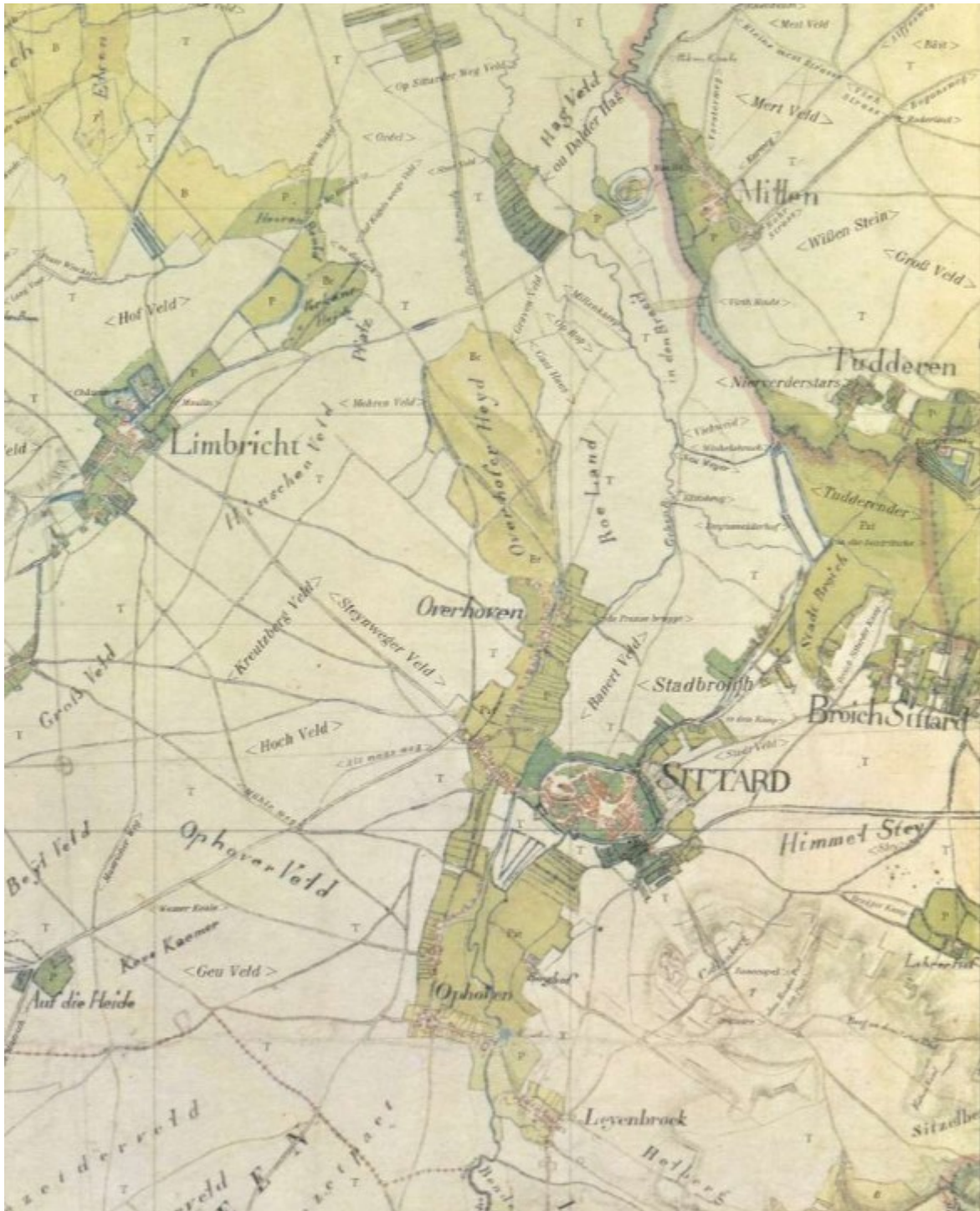
Overhoven en Overhovenerheide op de Tranchot-kaart.

De huidige wijk Overhoven is ontstaan uit een buurtschap gelegen vlak buiten de schootsvelden van de historische stad Sittard. Dit buurtschap was gelegen aan een weg die evenwijdig aan de Geleenbeek liep. Deze