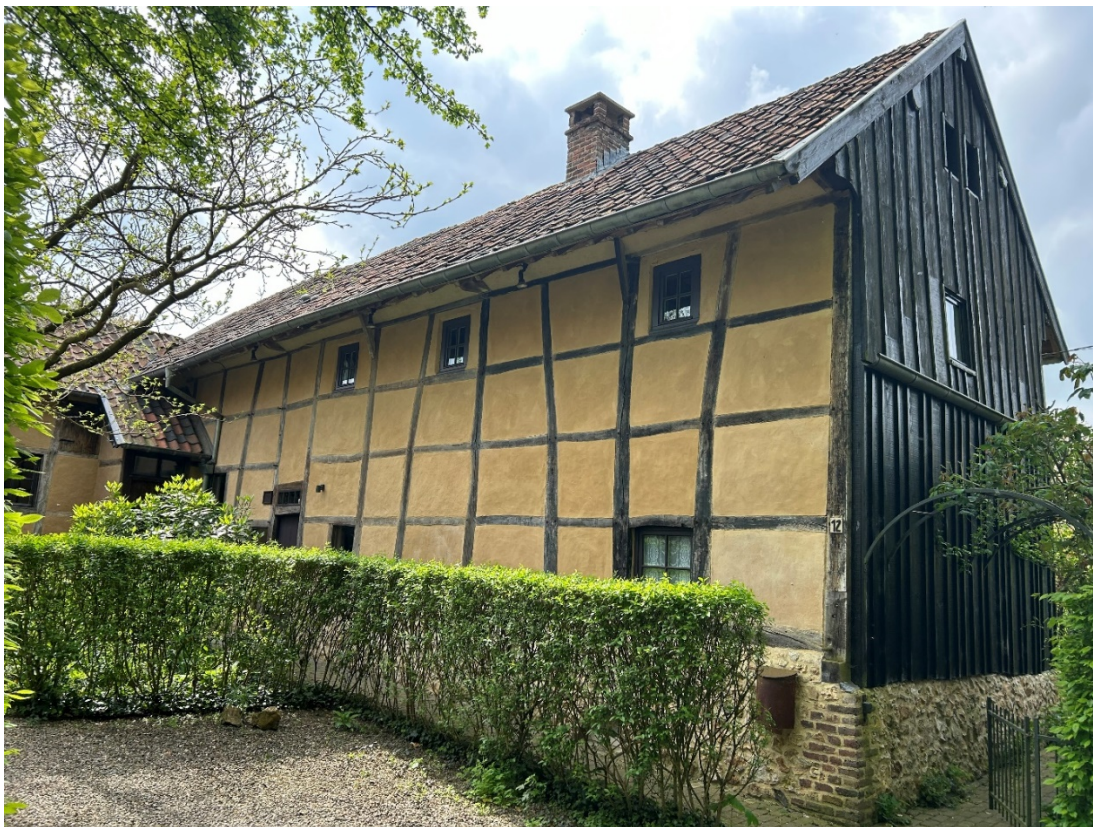
Vakwerkhuis met een moderne regenslag.

De onregelmatige vorm van de silexknollen ondermijnt echter de stabiliteit van de constructie. Daarom werd silex nagenoeg uitsluitend verwerkt in grote gevelvlakken, meestal zij- en achtergevels. Voor de afwerking aan de hoeken en rondom de ramen gebruikte men aanvankelijk kalksteen, later, vanaf de tweede helft van de 19 e eeuw, schakelde men hiervoor over op baksteen. De meer geometrische vorm van deze materialen maakte een betere stapeling mogelijk, zodat de constructie aan stevigheid won. Het is frappant dat het gebruik van mergelsteen of krijt in de burgerlijke architectuur van de Voerstreek niet voorkomt.