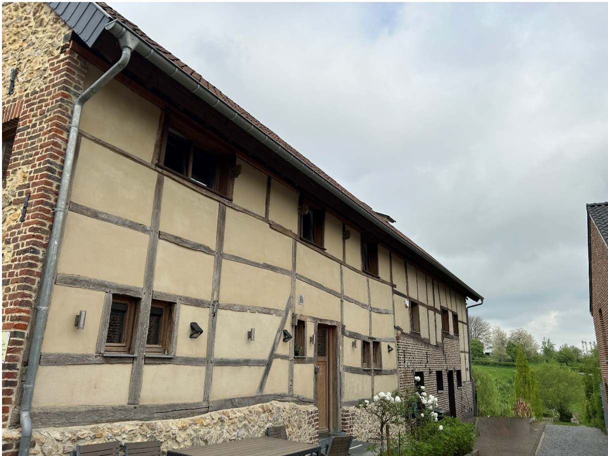
Zijaanzicht van het huis van Jetteke.

Alhoewel de vakwerkbouw geen exclusiviteit voor de Voerstreek is, vormen het golvende landschap en de charmante kleinschaligheid wel een uniek kader waarin het vakwerk, ook stijl- en regelwerk genoemd, optimaal tot zijn recht komt. Met vakwerkbouw bedoelt men de landelijke bouwstijl waarbij een houten gebinte aanvankelijk met lemen en later met bakstenen wanden opgevuld werden. Vakwerk vind je vooral in Veurs, Eind en Dal.