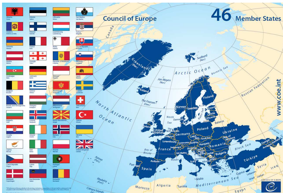
Afbeelding 1.2 - Leden van de Raad van Europa

Daarnaast zijn Canada, Israël, Japan, Mexico, Vaticaanstad en de VS toegelaten als waarnemers zonder stemrecht. Belarus en de Russische Federatie zijn in 2022 geroyeerd als lid, vanwege de aanval op Oekraïne door Rusland en de assistentie daarbij door Belarus.