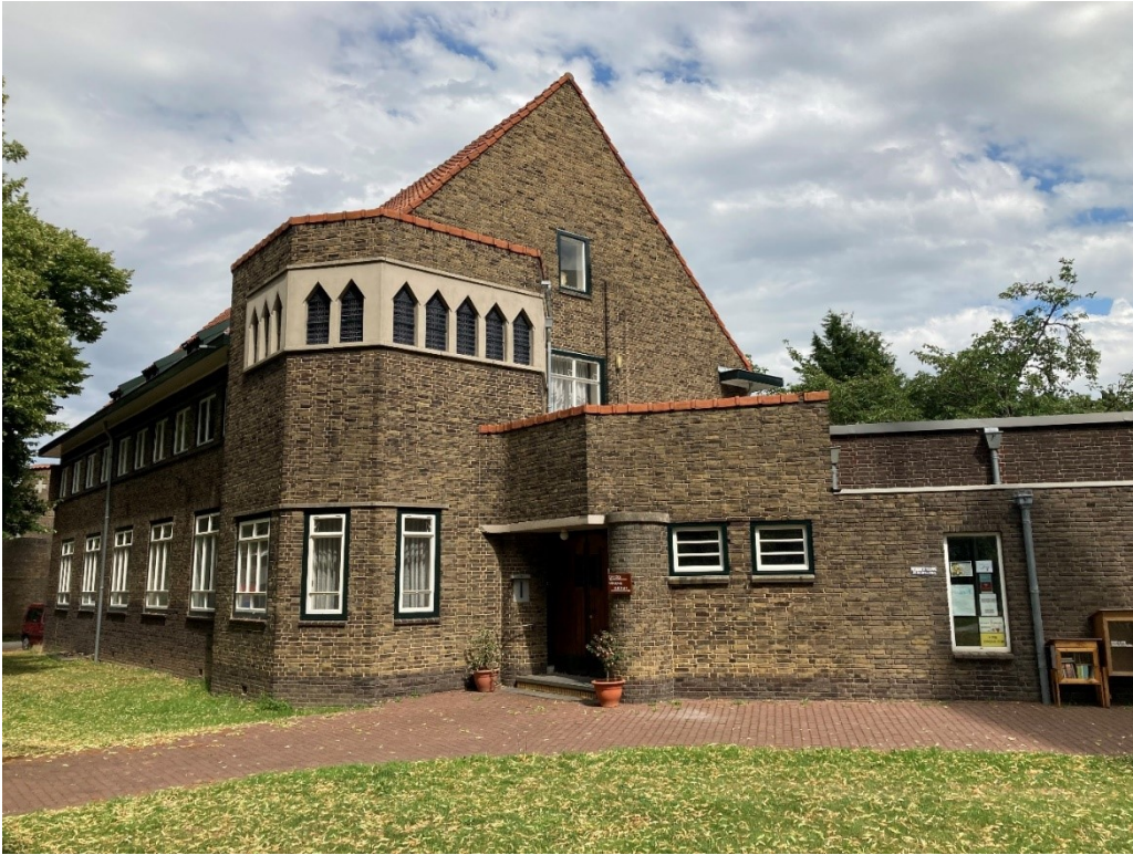
Rectoriaatwoning met rechts de minibieb.