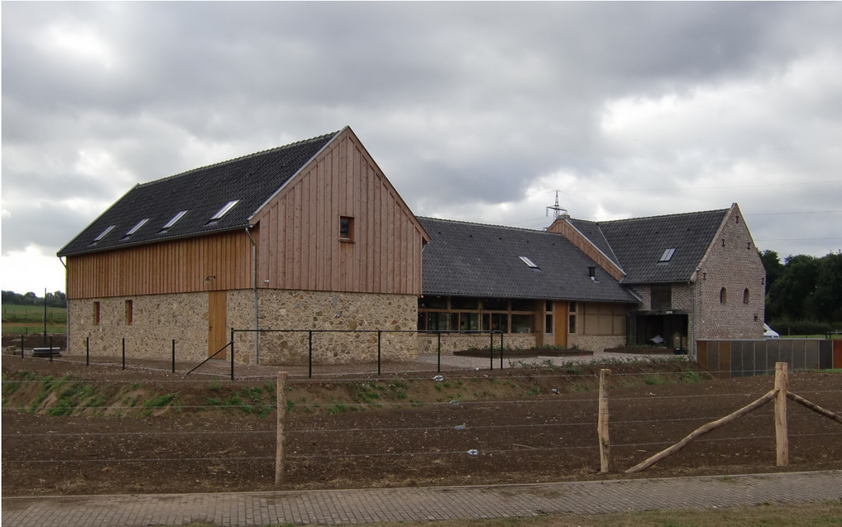
De verbouwde Oude Pastorie