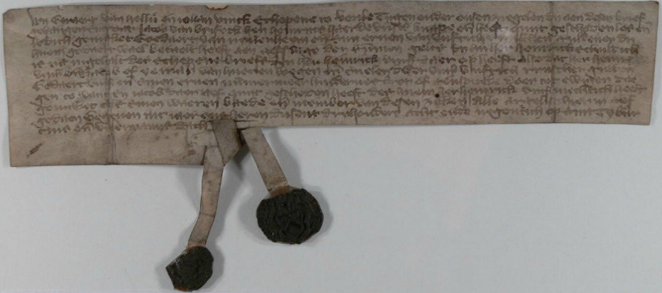
[1] De akte van verdeling uit 1472

Mariaweide op den duur het landgoed in bezit kreeg. Enige verwarring ontstaat dan als wordt aangenomen dat de hoeve Hagerhof (destijds eveneens omschreven als hof) wordt bedoeld, in plaats van het Huis op Wylre. Waarschijnlijk heeft het klooster dus eerst de hoeve overgenomen en pas later het kasteel.