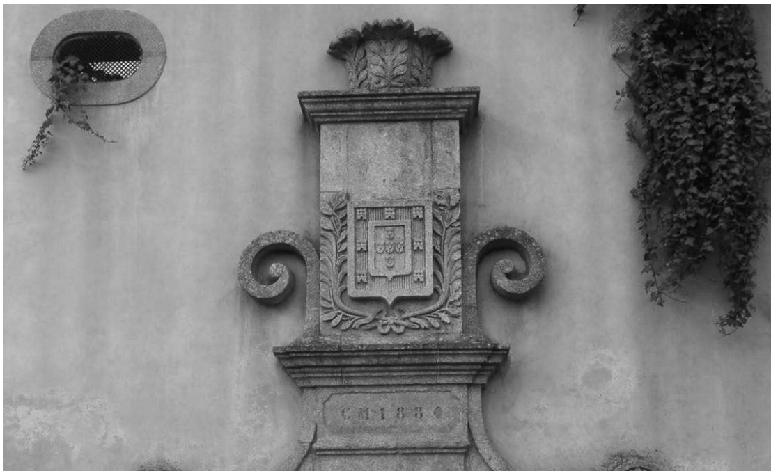
Fontanário da Rua Dr. António Cabral, Paredes, e seu brasão desprovido de coroa

Além dos edifícios de poder, ou institucionais, há ainda o fontanário construído em 1880 na actual rua Dr. António Moreira Cabral (traseiras da biblioteca municipal), que teria também, à data do 5 de Outubro, a respectiva coroa a encimar o brasão nacional.