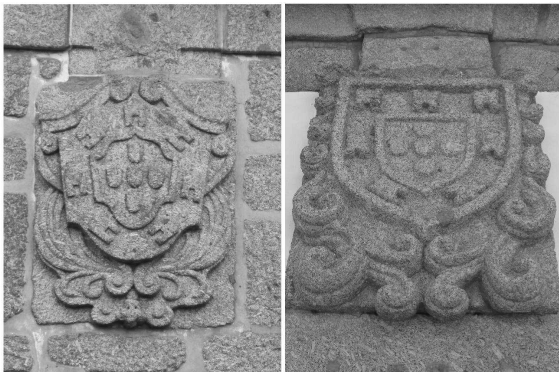
Brasões de Sobrosa (esq.) e de Paredes (dir.) sem as respectivas coroas, são hoje testemunhos visíveis da acção depuradora da Primeira República

estação postal permaneceu, até aos nossos dias, encimada pela coroa original, tal como era no «tempo dos reis».