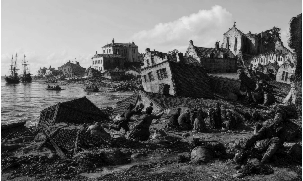
Moderne illustratie van de verwoesting van Port Royal tijdens de aardbeving van 7 juni 1692 om 11:43 uur, gevolgd door een tsunami met golven tot ca. 6 meter hoog. Gebaseerd op de 17de-eeuwse gravure van Pieter van der Aa.