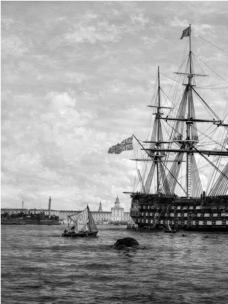
HMS Victory, first-rate linesschip met 104 kanonnen, bekend als het vlaggenschip van admiraal Horatio Nelson tijdens de Slag bij Trafalgar (1805). Het schip ligt vandaag nog steeds in Portsmouth Historic Dockyard, meer dan twee en een halve eeuw na haar tewaterlating.