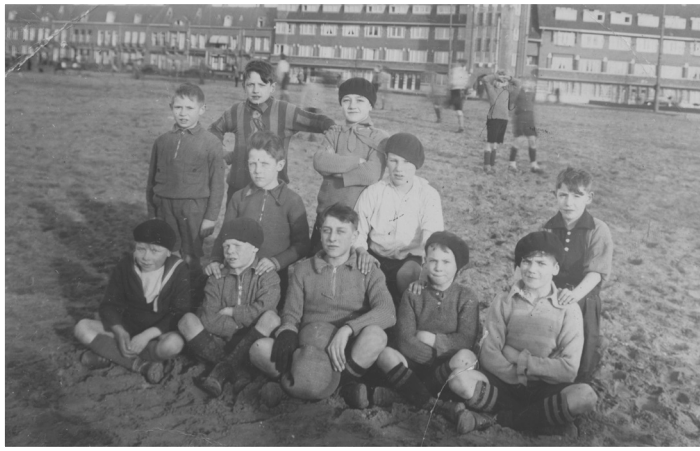
Ik zit op de voorste rij, tweede van links