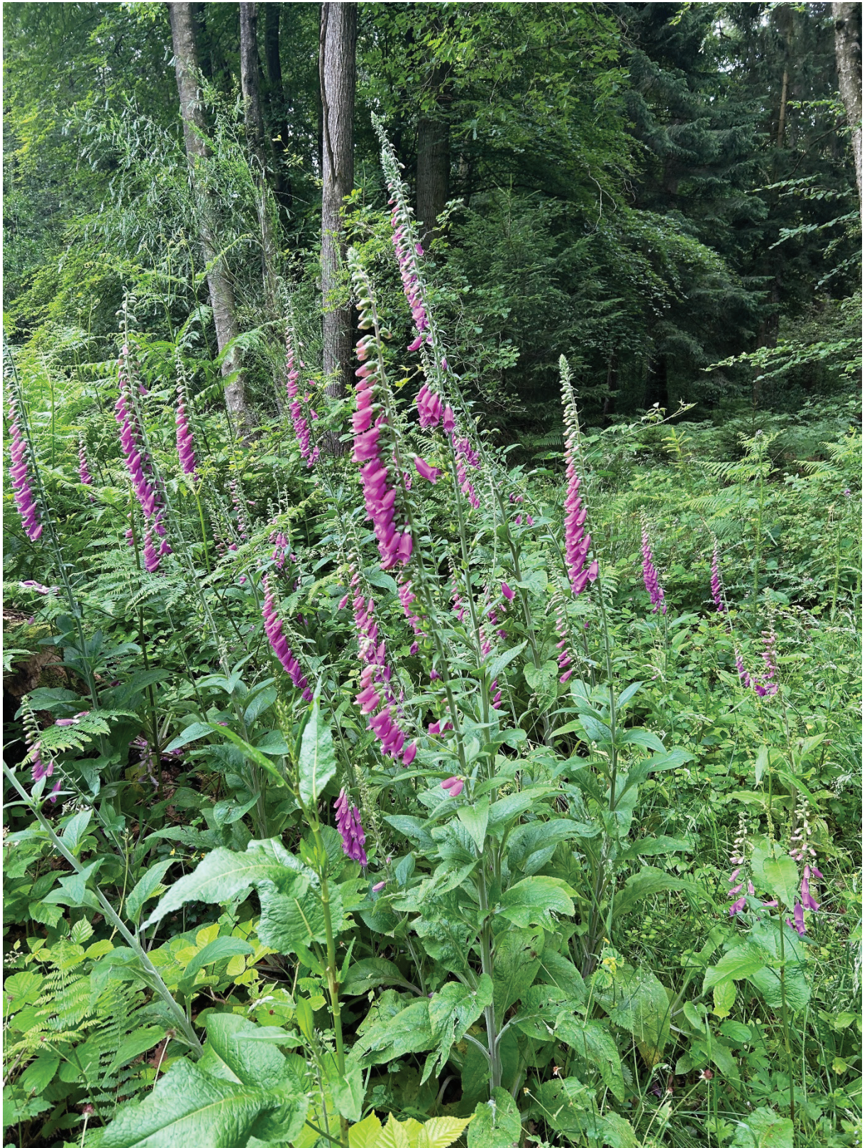
Digitalis in het wild.