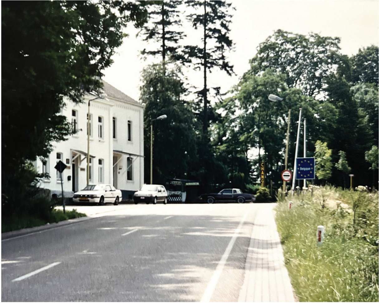
De pas Wolfhaag-Gemmenich (Gemmenicherlok).