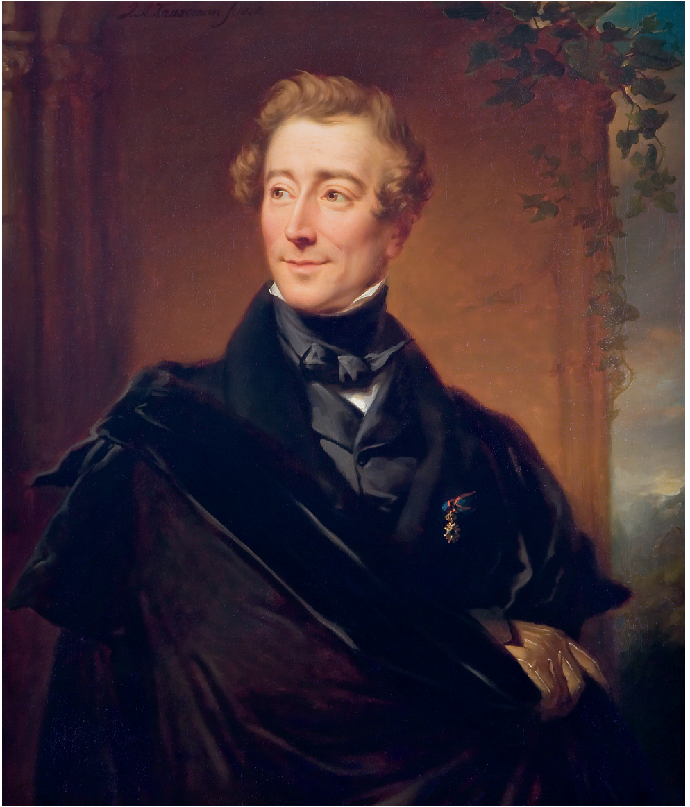
Jacob van Lennep. Schilderij door J.A. Kruseman 1838