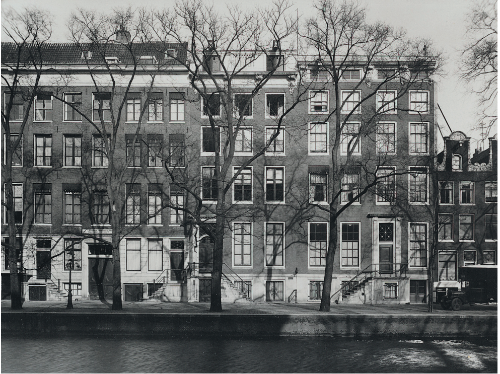
Geboortehuis van Jacob van Lennep, Keizersgracht 369. Foto ca. 1919