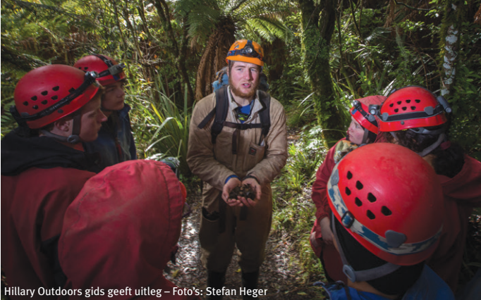
Hillary Outdoors gids geeft uitleg