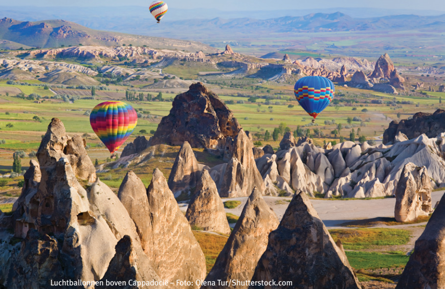
Luchtballonnen boven Cappadocië