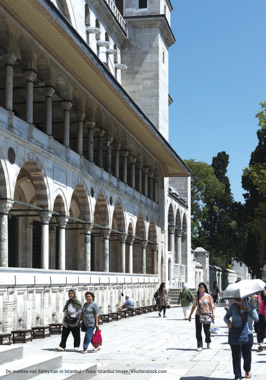
De moskee van Süleyman in Istanbul – Foto: Istanbul Image/Shutterstock.com