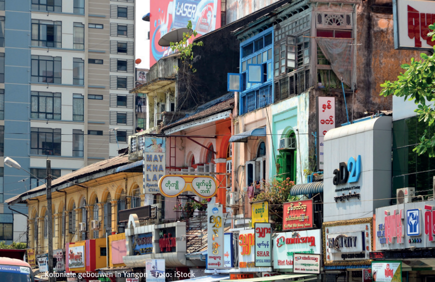
Koloniale gebouwen in Yangon – Foto: iStock

koloniale panden van de sloophamer te redden. In de loop der jaren zijn die gebouwen namelijk een belangrijk onderdeel van de Birmese cultuur geworden, vertelt YHT directrice Moe Moe Lwin me. “Deze gebouwen bepalen wie wij zijn. We moeten ons realiseren dat als ze eenmaal zijn verdwenen, ze nooit meer terugkomen.”