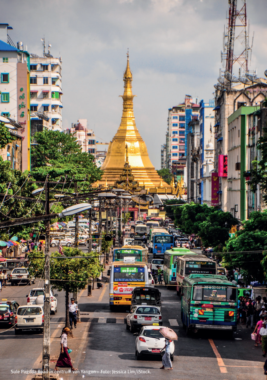
Sule Pagoda Road in centrum van Yangon – Foto: Jessica Lim/iStock.