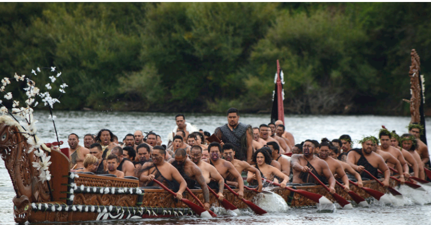
Maori in hun traditionele 'oorlogskano'

De jaarlijkse regatta wordt georganiseerd door de lokale Maori stam, die is vernoemd naar de rivier die door de regio stroomt, de Waikato. Deze is onderdeel van de Tainui waka of 'kano', wat in dit verband verwijst naar een groep stammen die met elkaar gemeen heeft dat alle stamgenoten hun afstamming kunnen herleiden tot de bemanning van de Tainui kano. Deze voer vanuit oost-Polynesië (waarschijnlijk Tahiti) en ging in de dertiende eeuw voor anker in Nieuw-Zeeland.