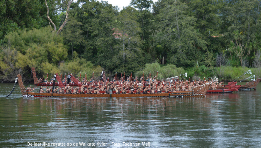
De jaarlijkse regatta op de Waikato rivier