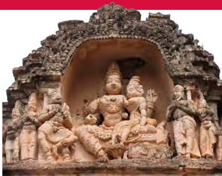
Virupaksha Tempel in Hampi, 350 km van Bangalore, India

In de jaren '30 van de 20 e eeuw zijn er ruïnes gevonden van een oude cultuur in het westelijk deel van Noord-India, Pakistan en Afghanistan. Deze cultuur zou hebben gebloeid tussen 2800 en 1700 voor Christus. De cultuur wordt Indus- of Harappa cultuur genoemd (Harappa is een van de belangrijkste vindplaatsen). Opmerkelijk is dat sommige gebruiken van het huidige hindoeïsme misschien al in die tijd bestonden. Zo zijn er grote vijvers of badplaatsen gevonden die lijken op de tempelvijvers van het huidige Zuid-India. Opmerkelijk is verder dat er zegels zijn gevonden met afbeeldingen van een hurkende man. Volgens sommige onderzoekers een aanwijzing dat er in de Induscultuur al aan yoga werd gedaan en werd gemediteerd.