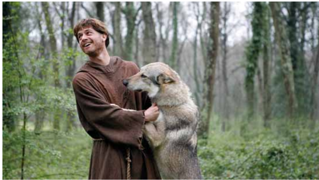
Filmstill uit 'Claire and Francis'