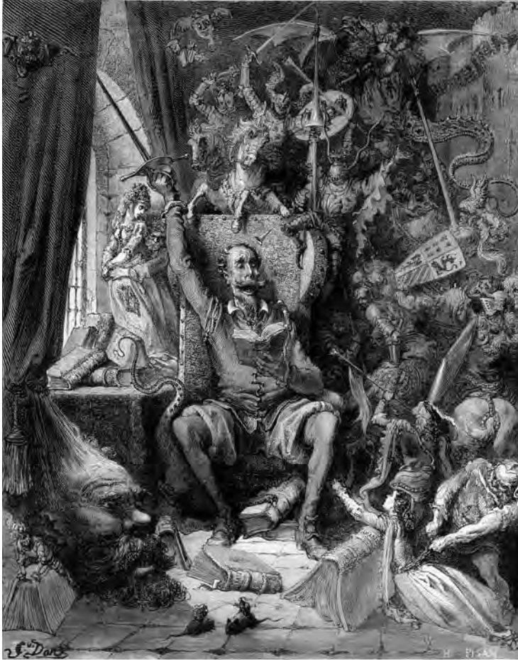
Portret van Don Quichot (G. Doré, 1863)