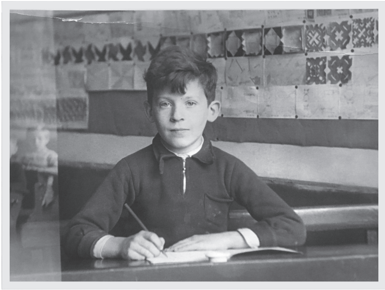
Schooljaar 1941-1942 - 10 jaar