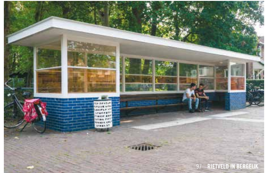
97 RIETVELD IN BERGEIJK

Het dorpje Bergeijk was begin 20e eeuw een magneet voor ontwerpers die werden geassocieerd met de kunststroming De Stijl. Gerrit Rietveld liet er zijn sporen na, net als meubelontwerper Mart Stam en landschapontwerper Mien Ruys. Wachten op de bus was nog nooit zo'n stijlvolle aangelegenheid als in dit Rietveld-bushokje, met schuin er tegenover een zwart-witte Rietveld-klok. Vergeet ook niet een bezoek te brengen aan de voormalige De Ploegfabriek (Riethovensedijk 20), ontworpen door Rietveld, en de aanpalende tuin van Mien Ruys. Je vindt het gebouw gemakkelijk met de app of kaart van de Rietveld-wandeling, te verkrijgen via de VVV.