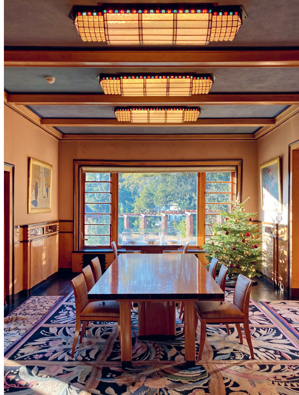
Léo Erreralaan 41, Léon Govaerts & Alexis Van Vaerenbergh (1928)