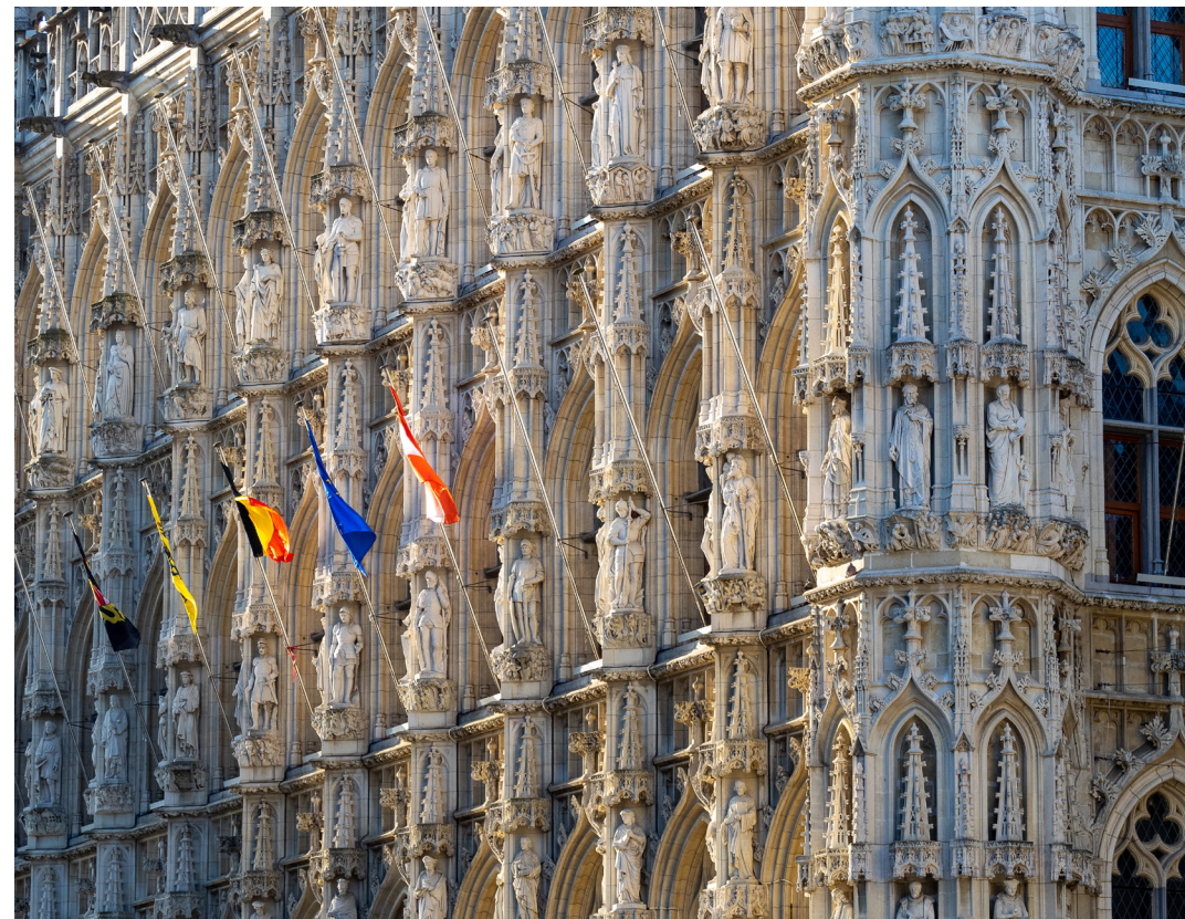
De weelderige gevel van het gotische stadhuis, een publiekstrekker vroeger en nu