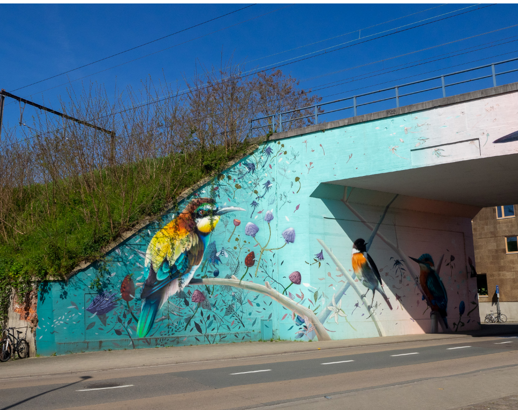
4 De mural van Super A & Collin van der Sluys onder de spoorwegbrug tussen de Hovenierdreef en de Parkabdij