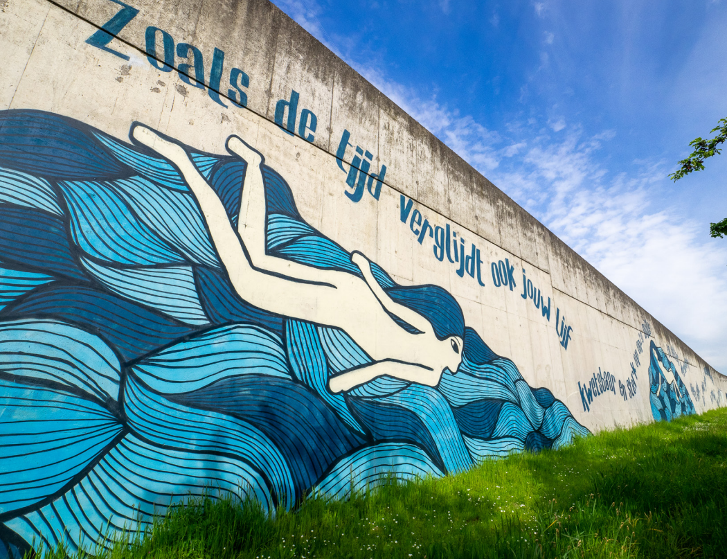
4 De mural Fiere Margriet van Stina De Roeck en Warsnoes op het viaduct bij het Artoisplein