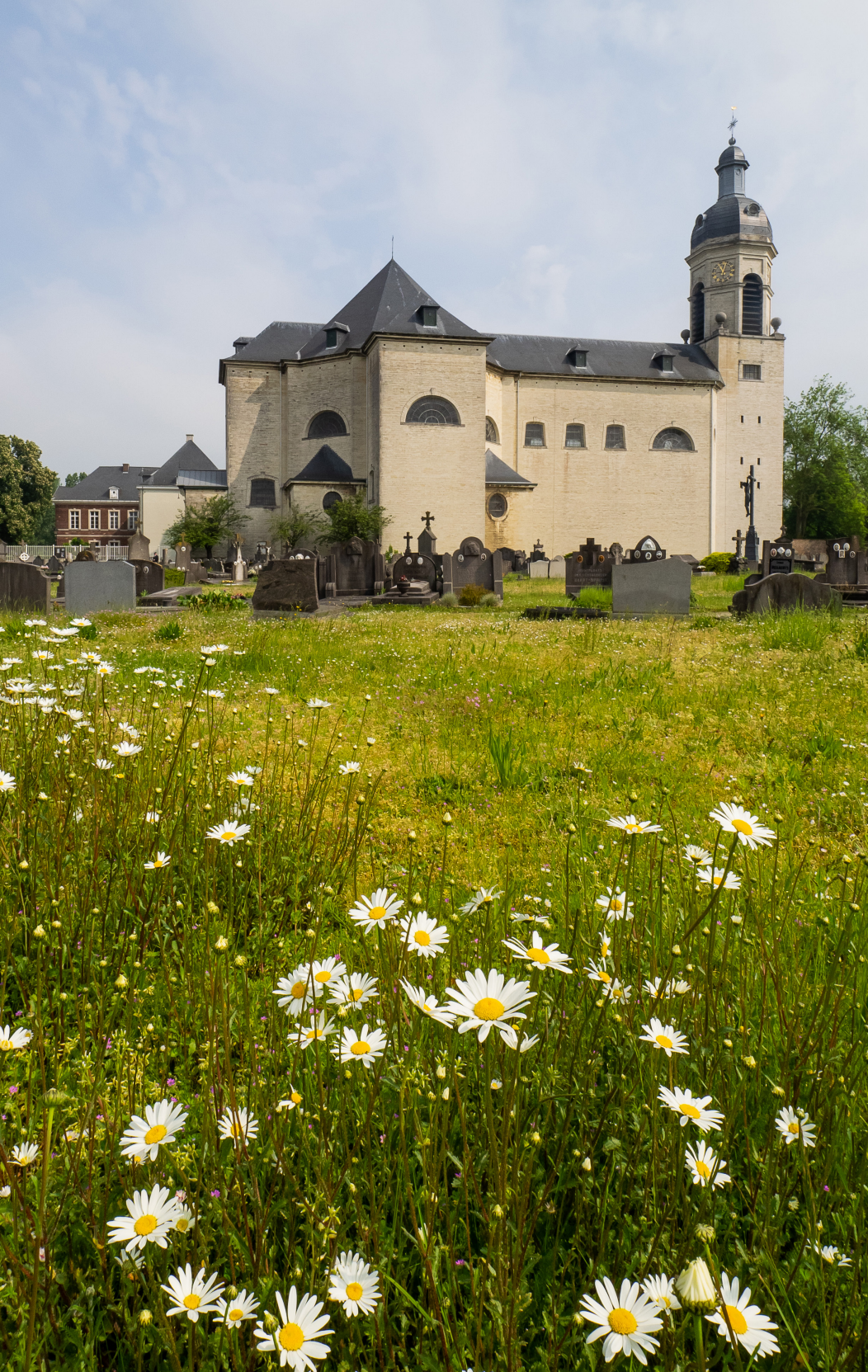
De abdij van Vlierbeek in Kessel-Lo

Een van de oudste abdijen van België staat in het gehucht Vlierbeek, tegenwoordig een wijk in deelgemeente Kessel-Lo. In 1125 schonk Godfried met de Baard, graaf van Leuven, daar aan de benedictijnen van Affligem een lap grond om er een kerk met klooster op te richten. Van die eerste constructie blijft nauwelijks iets over: slechts de benedenverdieping van het oude abtskwartier, de Westervoort en het portiergebouw hebben de godsdienstoorlogen van 1572 overleefd. Vlakbij wenkt de bruine kroeg In Den Rozenkrans , ooit een studentencafé en rond 1970 het gedroomde decor voor enkele scènes van de immens populaire BRT-televisiereeks Wij, heren van Zichem , naar de verhalen van Ernest Claes. Het café dankt zijn naam trouwens aan een decorstuk uit de serie, dat ter plaatse was achtergebleven. De couleur locale van toen is (in zwart-wit) integraal te bekijken op vrt.max, netjes voorzien van het label 'Deze reeks kan verouderde denkbeelden & taalgebruik bevatten'. Dat is een understatement. Voor nog meer nostalgie zorgden Janneke en Bertha, die het café net geen halve eeuw lang hebben uitgebaat en in 1972 door folkgroep Rum in een instrumentaal streepje muziek zijn vereeuwigd.