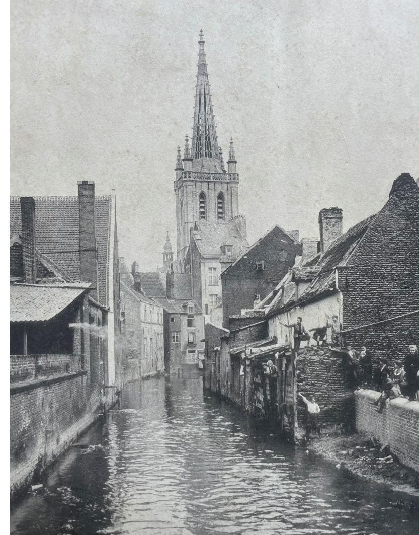
De Sint-Geertruikerk en de Dijle, ca. 1900

Zweig had geen ongelijk. Leuven was op zijn retour, en voor de zo noodzakelijke hogere versnelling moest deze stad aan de Dijle wachten op de wederopbouw na de Eerste Wereldoorlog en op een volgende, al even wrede oorlog – er zijn er geen andere. Of op de roes van de mei-dagen in 1968, toen de jeugd zichzelf op straat opnieuw