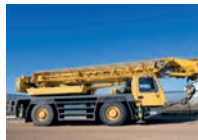
de mobiele kraan