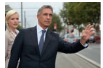
een taxi aanroepen