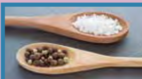
sal y pimienta