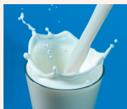
1. il latte