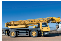
de mobiele kraan a grua móvel