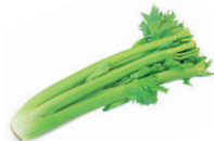
de selderij o aipo