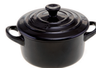
de stoofpan a panela