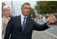
een taxi aanroepen fazer sinal para um táxi