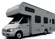
de camper a autocaravana