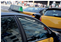
de taxistandplaats a paragem de táxi