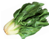
de snijbiet o acelga