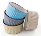
de ramequin a forma de soufflé