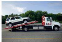
de sleepwagen o veículo de reboque