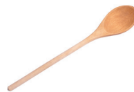
de pollepel a colher de pau