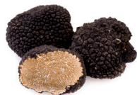
de truffel a trufa