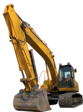
de graafmachine a escavadora