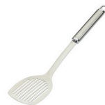
de bakspatel a espátula