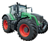
de tractor o trator