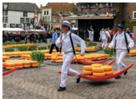
de Alkmaarse kaasmarkt