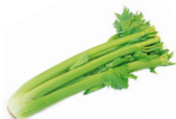
de selderij 芹菜 qíncài