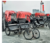
黄包车 huángbāochē de riksja