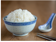
饭碗 fǎnwǎn de rijstkom