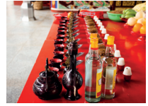
茅台酒 máotáijiǔ de maotaibrandewijn (uit rode gierst en tarwe)