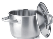
de kookpan 煮锅 zhǔguō