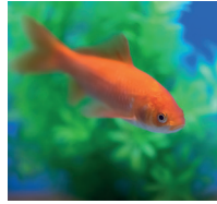
金鱼 jīnyú de goudvis (symbool voor geluk en vruchtbaarheid)