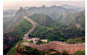
万里长城 Wàn Lǐ Chángchéng de Chinese Muur