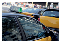
de taxistandplaats 出租车候客站 chūzūchē hòukèzhàn