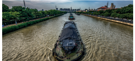
京杭大运河 Jīngháng Dàyùnhé het Keizerkanaal (Unesco Werelderfgoed; langste door mensen gemaakte waterweg)