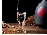
白酒 báijiǔ de brandewijn (uit rijst, gierst, mais, tarwe)