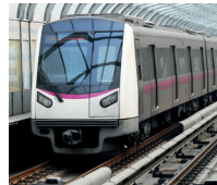
地铁 dìtiě de metro