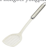
de bakspatel 漏铲 lòuchǎn