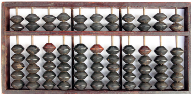
算盘 suànpán het oud-Chinese telraam