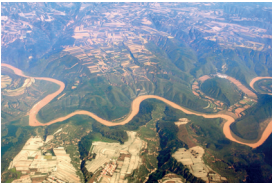
黄河 Huánghé de Huanghe (de 'gele rivier')