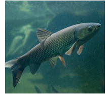
鲤鱼 lǐyú de karper (symbool voor welvaart)