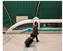
上海磁悬浮示范运营线 shànghǎi cífú shìfàn yùnyíng xiàn de transrapid (Shanghai)