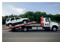
de sleepwagen 救援车 jiùyuánchē