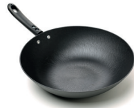
炒锅 chǎoguō de wok