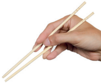
筷子 kuàizi de eetstokjes (in China dikker en stomp aan onderzijde)