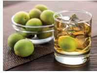
梅酒 méijiǔ de pruimenwijn