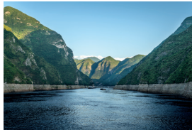
长江 Chángjiāng de Yangtze (langste rivier van China)