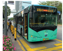
公共汽车 gōnggòng qìchē de bus