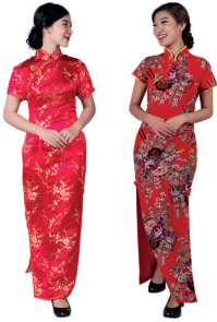
旗袍 qípáo de qipao (traditionele Chinese vrouwenjurk)