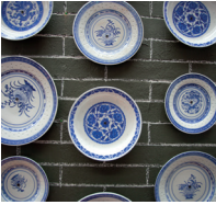
瓷器 cíqì het porselein