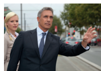
een taxi aanroepen 扬招出租车 yángzhāo chūzūchē