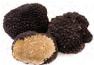
de truffel tryffel -n u