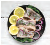
sill -en u de haring