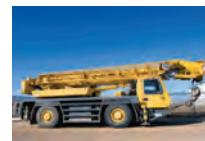
de mobile kran fordonskran -en u