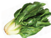
de snijbiet mangold -en u