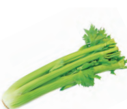
de selderij stjälkselleri -n u