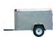
de aanhangwagen släpvagn -en u