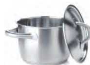
de kookpan kastrull -en u