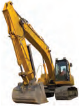
de graafmachine grävmaskin -en u