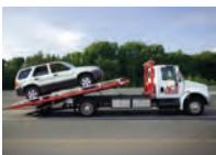
de sleepwagen bärgningsbil -en u