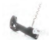
de kurkentrekker korkskruv -en u

Keuken- en bakbenodigdheden – köks- och bakgrejor