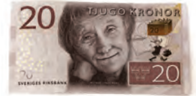
Astrid Lindgren (1907-2002) bekende kinderboekenschrijfster