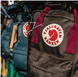
Fjällräven® het merk voor outdoor kleding en -uitrusting, vooral bekend van de vierkante kånkenrugzak