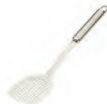
de bakspatel stekspade -n u