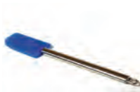
de deegspatel degskrapa -n u