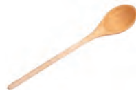
de pollepel slev -en u