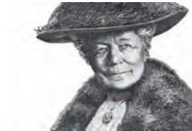
Selma Lagerlöf (1858-1940) schrijfster van De wonderbare reis van Nils Holgersson