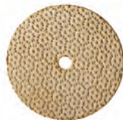
knäckebröd -et n het knäckebröd