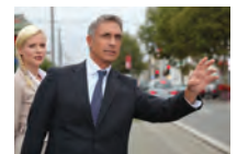
een taxi aanroepen att vinka in en taxi