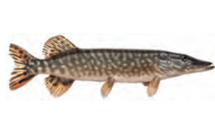
gädda -n u de snoek