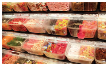
lördagsgodis -et n het zaterdagsnoep (vroeger was het gebruikelijk, dat kinderen op zaterdag een zakje met typisch Zweedse snoepjes mochten samenstellen)