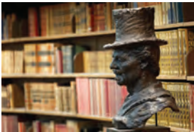
August Strindberg (1849-1912) vooral bekend door zijn toneelstukken