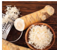
pepparrot -en u de mieriikswortel