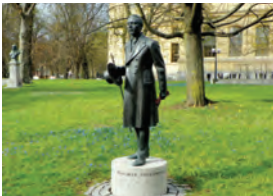
Hjalmar Söderberg (1869-1941) schrijver