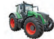
de tractor traktor -n u