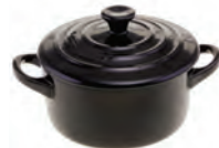
de stoofpan gryta -n u