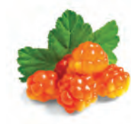
hortron -et n de kruitbraam