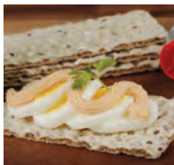
kaviar -en u de kaviaar (klassiek Zweeds broodbeleg uit een tube, gemaakt van de kuit van o.a. kabeljauw)