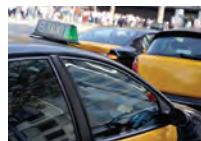
de taxistandplaats taxistation -en u