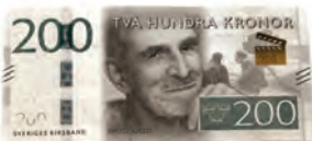
Ingmar Bergman (1918-2007) beroemde scenarioschrijver en regisseur