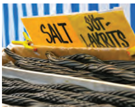
lakrits -en u de drop