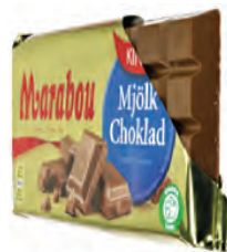
mjölchchoklad -en u de melkchocolade