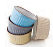
de ramequin ugnform -en u