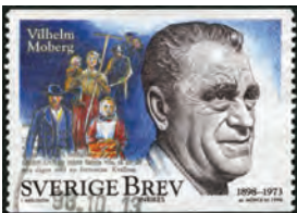
Vilhelm Moberg (1898-1973) schrijver en maatschappijcriticus