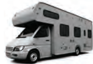
de camper husbil -en u