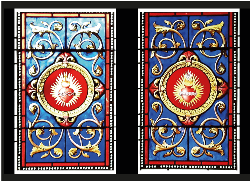
Het mannelijke & vrouwelijke Heilig Hart, Villa Béthania, Rennes-le-Château