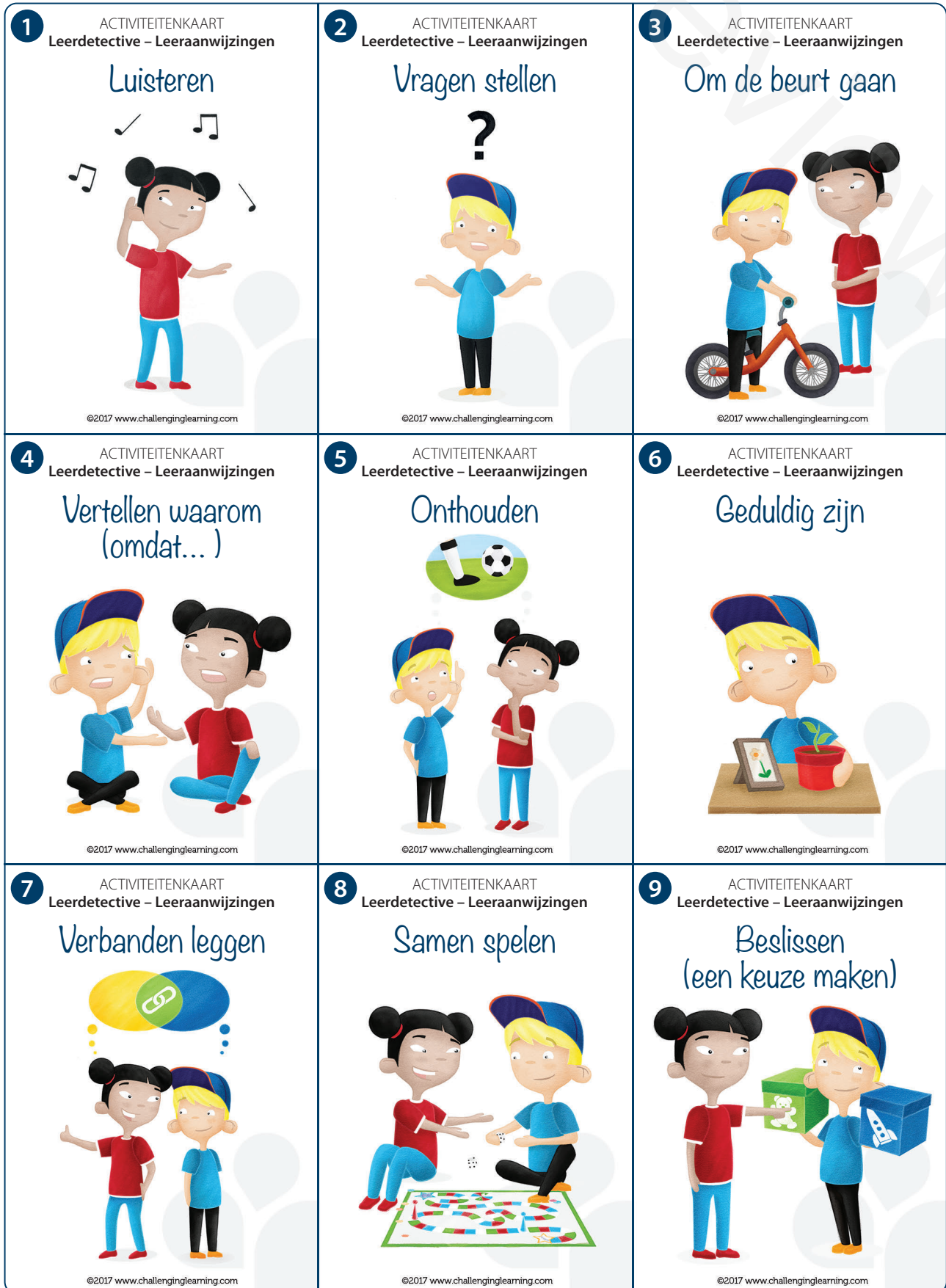
Figuur 5: Leerdetectivekaarten